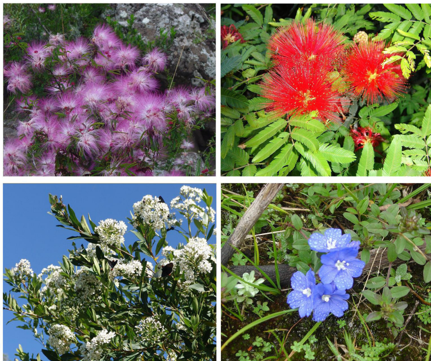
Figura 4. Espécies de eudicotiledôneas ornamentais selecionadas. Da direita para a esquerda: Calliandra brevipes Benth.; Calliandra tweedii Benth.; Escallonia bifida Link e Otto; Evolvulus glomeratus Nees e C. Mart. Figure 4. Selected species of ornamental Eudicotyledons. From right to left: Calliandra brevipes Benth.; Calliandra tweedii Benth.; Escallonia bifida Link & Otto; Evolvulus glomeratus Nees & C. Mart.