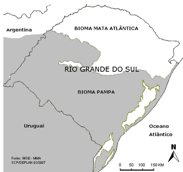
Figura 2. Mapa de biomas no Rio Grande do Sul. Figure 2. Map of biomes in Rio Grande do Sul.