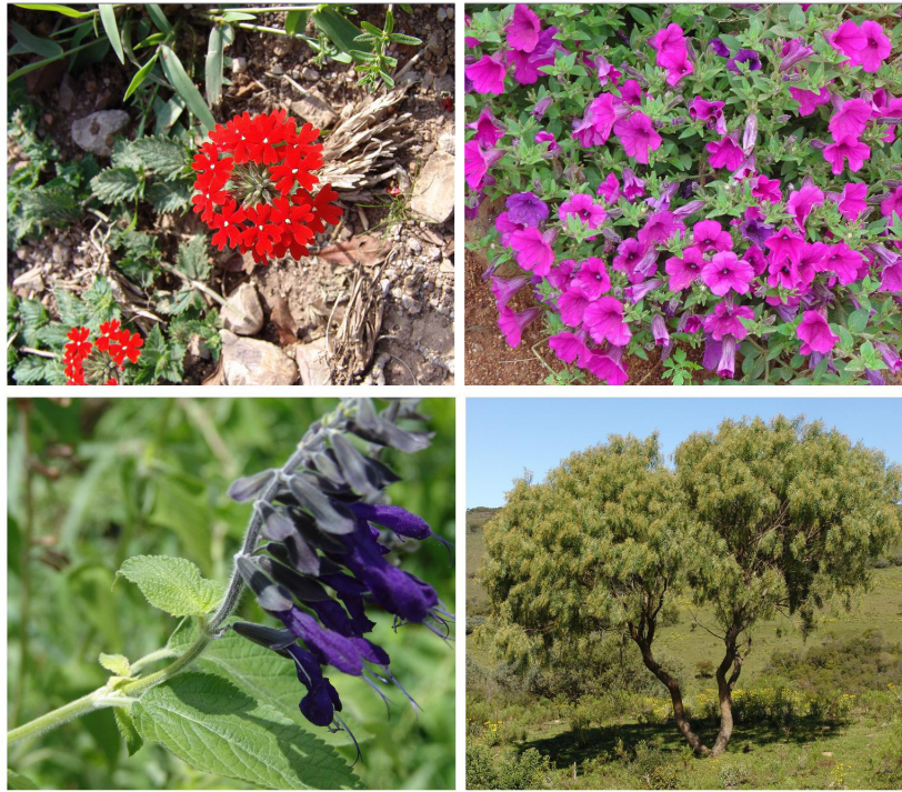
Figura 5. Espécies de eudicotiledôneas ornamentais selecionadas. Da direita para a esquerda: Glandularia cabrerai (Moldenke) Botta; Petunia integrifolia (Hook.); Salvia guaranitica A.St.Hil. ex Benth.; Schinus molle L.

Figure 5. Selected species of ornamental Eudicotyledons. From right to left: Glandularia cabrerai (Moldenke) Botta; Petunia integrifolia (Hook.); Salvia guaranitica A.St.Hil. ex Benth.; Schinus molle L.