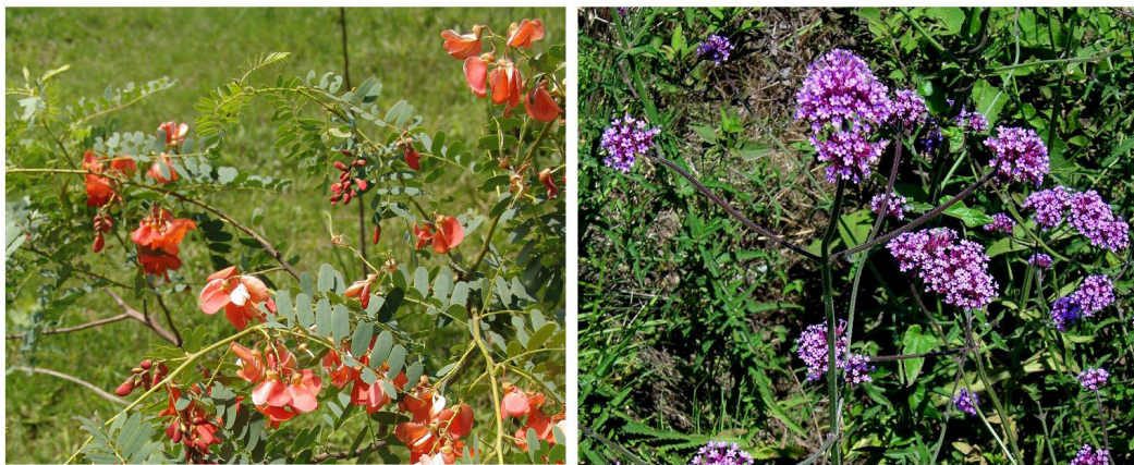
Figura 6. Espécies de eudicotiledônias ornamentais selecionadas. Da direita para a esquerda: Sesbania punicea (Cav.) Benth.; Verbena bonariensis L.

Figure 5. Selected species of ornamental Eudicotyledons. From right to left: Glandularia cabrerai (Moldenke) Botta; Petunia integrifolia (Hook.); Salvia guaranitica A.St.Hil. ex Benth.; Schinus molle L.