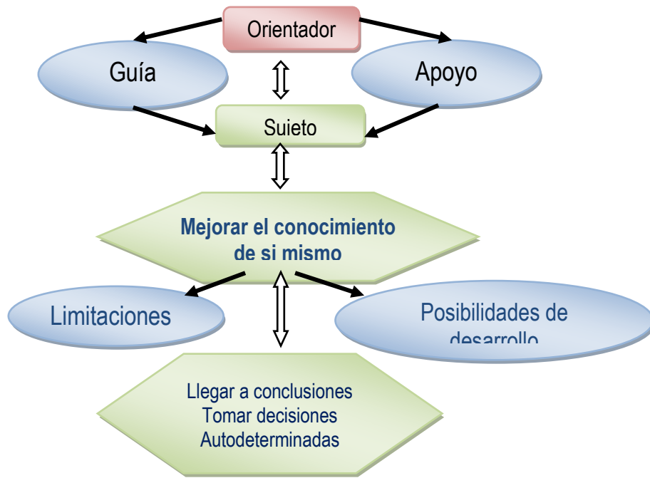
Fig.2. Relación de ayuda