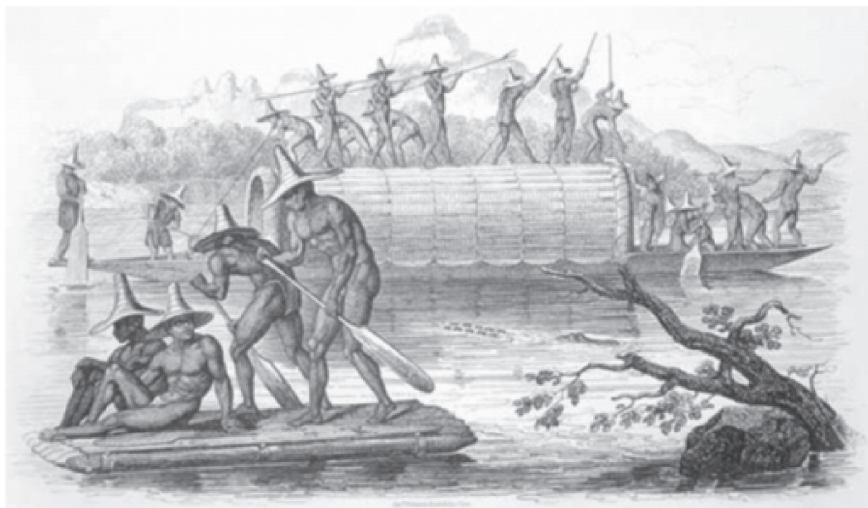
Alcide Dessalines d'Orbigny, Navigation sur la Magdalena, Biblioteca Luis Ángel Arango, Sala de Libros Raros y Manuscritos, Identificador 468, 11 x 18.3 cm