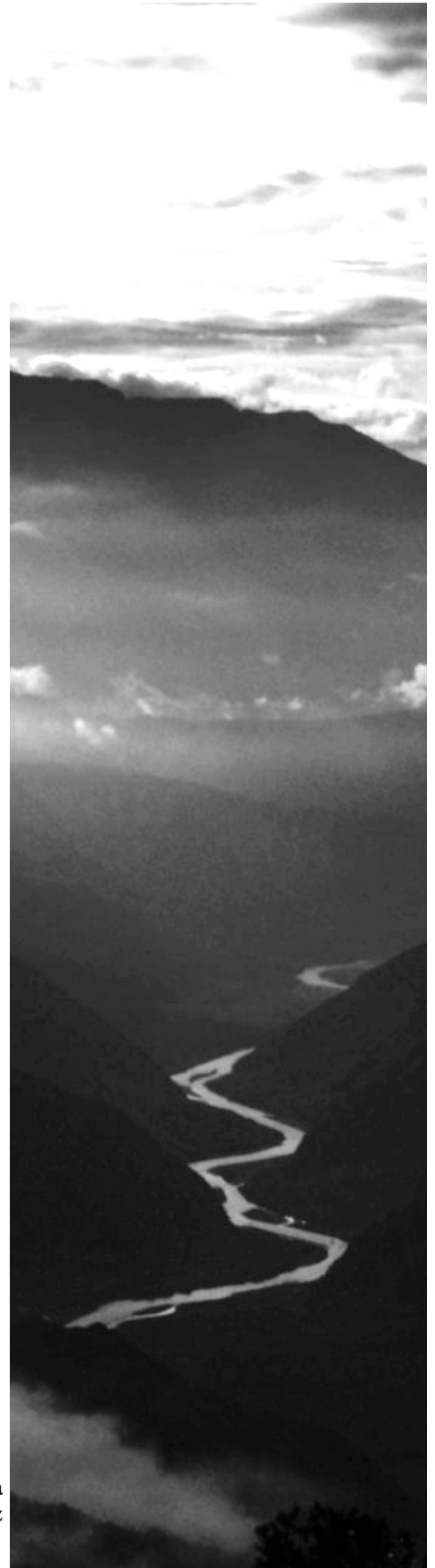
Cañón del Chicamocha Fotografía (fragmento) Oscar Martínez Vásquez