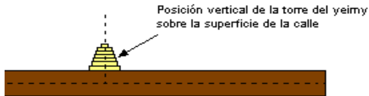
Figura 11. Representación de la torre en posición vertical sobre el terreno plano.

Otro juego que involucra un objeto en posición vertical, es el Yeimy, pues cuando identifican que los tejos deben estar siempre en la posición vertical (parados sobre la calle), como se muestra en la figura 11, se puede entonces con esto reconocer una característica de la verticalidad.