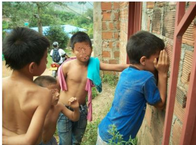
Figura 2. Niños jugando a Sangre Fría.

“punto y coma” 7 , el jugador que estaba de espaldas, decide la manera con la que el jugador que lo tocó se va a desplazar hacia un lugar indicado y debe ser por medio de “forma león, canguro o tortuga”. 8 La ida y el regreso pueden ser de formas diferentes o iguales y a su regreso debe hacerlo de la forma indicada pero de espaldas. Mientras el jugador se dirige al lugar indicado, los demás jugadores se esconden. Gana el jugador que cuncliye a todos los jugadores. El jugador que cuncliyaron 9 de primero es quien inicia el siguiente juego o si alguien “salva patria” 10 vuelve y queda el mismo jugador.