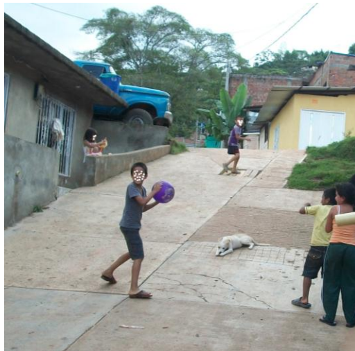
Figura 3. Niños jugando Bobby en una zona de ladera.

Características: Es un juego donde no hay límite de jugadores, se debe tener en cuenta que los jugadores deben recorrer las bases en el orden asignado, una a una y que en estas no se puede ponchar a nadie. Gana quien tenga menos rayas en el cuadro del juego. Cuando el tejo es lanzado por un jugador y cae en raya, debe volver a lanzar, si cae por fuera del cuadro lanza el siguiente, el orden de los jugadores para lanzar el tejo es el mismo orden de la ubicación de los jugadores en el cuadro.