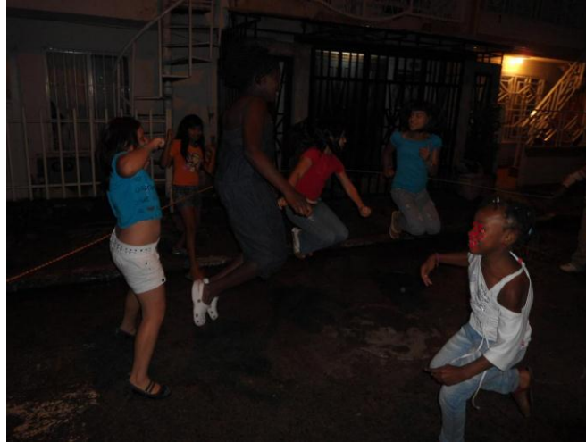
Figura 7. Niñas saltando lazo en horas de la noche. Una de ellas se presta a entrar al juego. Calle plana.