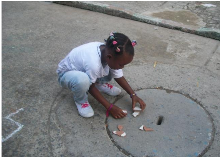
Figura 4. Niña armando desesperadamente la torre de tejos, antes de que la ponchen con la pelota.

Características: Es un juego donde no hay límite de jugadores y los jugadores del equipo que lanza la pelota para derribar los tejos tienen un turno a la vez. Si un jugador es ponchado no puede armar los tejos y los jugadores que están ponchados no deben derribar los tejos, gana el equipo cuando poncha a todos los jugadores del otro equipo evitando que armen la torre con los tejos. Se debe indicar límites en la zona para que los jugadores se desplacen.