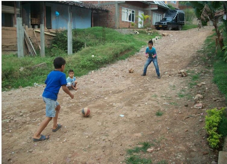
Figura 1. Arquero en posición de atajada. Arco colocado en la parte superior de la “cancha”.

patea, el balón no se aleja de la zona de juego, la razón por la cual en este juego el arquero no se ubica en la parte baja de la calle, es porque si los lanzamientos realizados por quien patea no son atrapados por el arquero, entonces el balón rodaría hacia las partes más bajas de la calle, el jugador que patea, se ubica en la parte inferior de la calle, con el fin de manejar el balón con más facilidad lo que no se podría hacer, si el balón se ubicara en la parte superior, pues este no estaría estable. Cada jugador tiene la misma cantidad de turnos para patear y para estar en la cancha (tres turnos). En la calle casi plana o en la cancha de la vereda, no hay problema en la ubicación de los jugadores. No hay muchas reglas estipuladas para el desarrollo del juego.