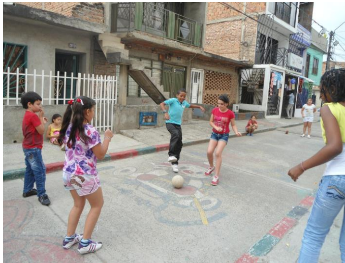
Figura 6. Fútbol mixto en calle plana.

Características: En este juego no hay límites de jugadores, se realiza sin árbitros, los jugadores se dividen en dos equipos. Para la practica de este no existe distinción de sexo, ver figura 6, cuando el balón sale del terreno de juego se cobra saque lateral o saque de arco. Gana el equipo que haya anotado más goles.