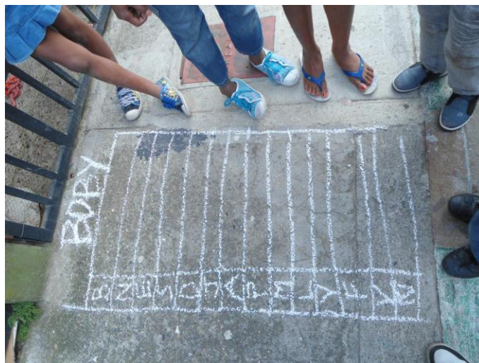
Figura 5. Tabla de control empleada en el juego “Boby”. Posición totalmente horizontal.

La práctica de este juego en Mojica es similar a la descrita en la Sirena, lo único que se le anexa es que en Mojica a parte del cuadro o tabla que se realiza en el piso donde escriben las iniciales de los nombres de los jugadores, ver figura 5, también hacen un círculo donde escriben Boby en el cual ubican la pelota y deben llegar los jugadores cuando terminan el recorrido por las bases para decir Boby y así no ser ponchados.