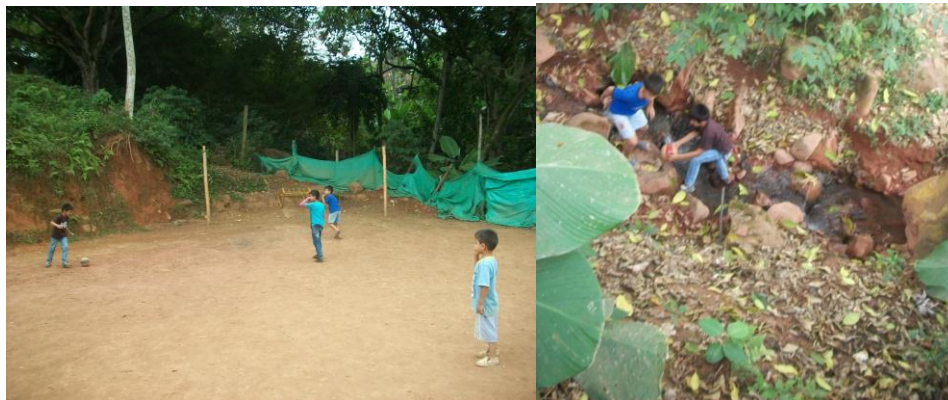
Figura 9. Niños jugando en una cancha de fútbol que al lado tiene un abismo o caño.

En las noches, debido al entorno, el juego no se practica, pues existen miedos en bajar al arroyo, que está plenamente oscuro, para recoger el balón. En cambio en las zonas planas estas restricciones no las hay. Se puede jugar a cualquier hora del día y solo si van pasando personas por la calle-cancha, miden la fuerza de la pateada.