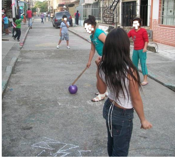
Figura 8. Niños jugando Yeimy en una zona plana.