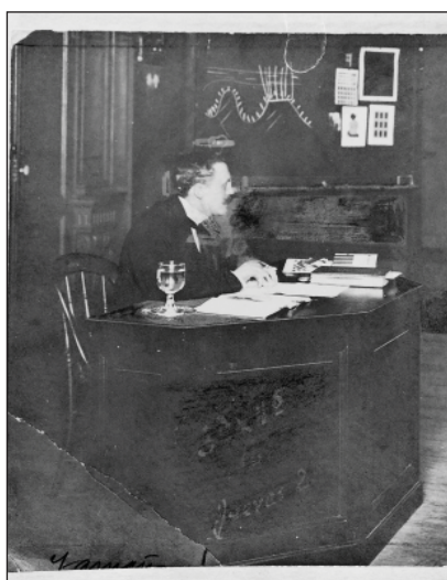
Figura N° 2 - Roberto Lehmann-Nitsche dando una conferencia en la Facultad de Filosofía y Letras en 1903 (Archivo General de la Nación).