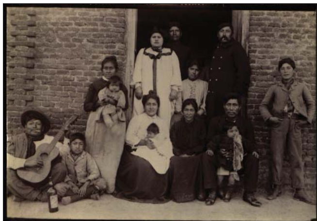
Figura N° 3 - En el reverso de la fotografía, se lee "Grupo de Araucanos, La Plata" escrito por el antropólogo alemán (Legado Lehmann-Nitsche, Instituto Ibero-Americano de Berlin).