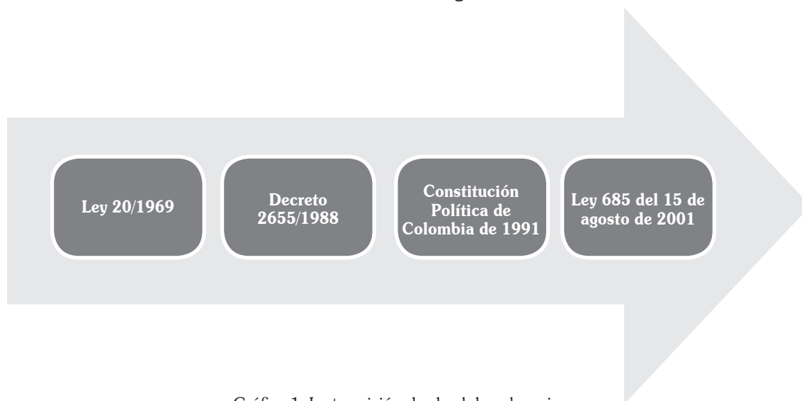
Gráfica 1. La transición desde el derecho minero

Y desde la perspectiva ambiental encontramos especialmente las normas que se muestran en la gráfica 2.