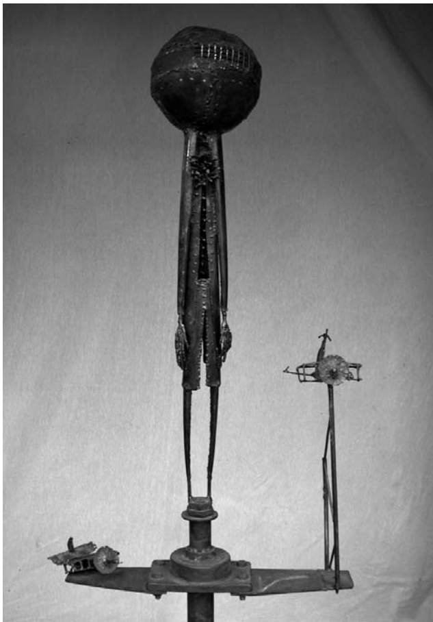
“La inocencia armada”, hierro reciclado y soldado. Ruben Schaap

Se advierte aquí también una influencia importante de la biografía escolar, es decir el período vivido en la escuela como alumno, lo que tiene impacto en la conformación de es-