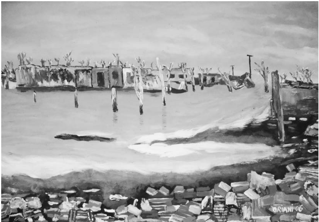
“Restos de Epecuén”, óleo Carlos Oriani

Para el docente apasionado, la “conectividad” con los alumnos es una prioridad para alentar la motivación y el entusiasmo (Day, 2006: 42). Esta conectividad forma parte de la enseñanza, porque: “La palabra es enseñanza” (Levinas, 2002: 129). La enseñanza no transmite un contenido abstracto, no consiste en asumir una función, la palabra insta la comunidad, en una tematiza-