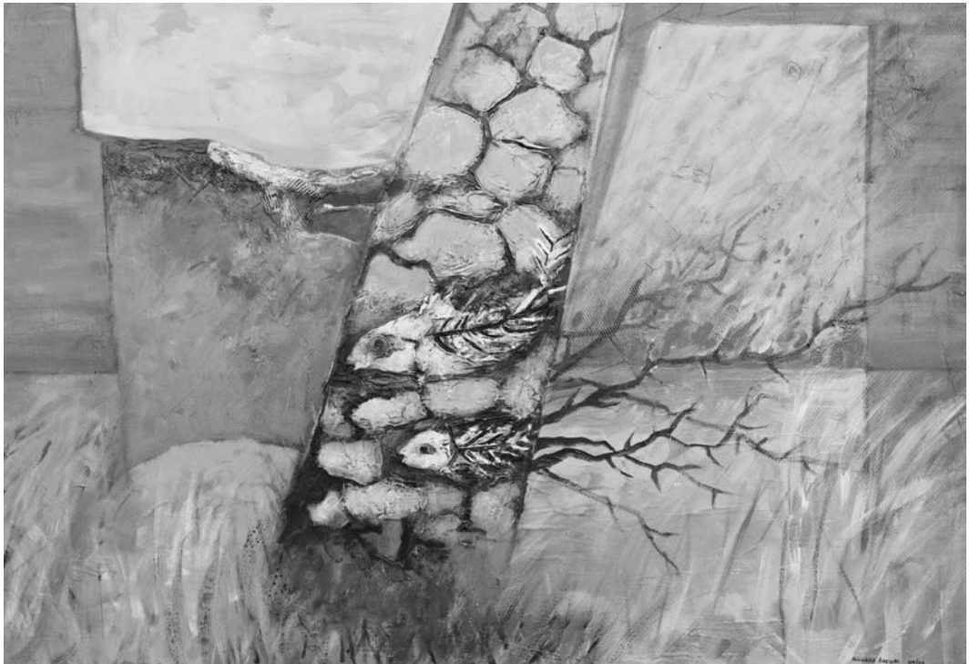
"Postales de hoy", acrílico Ricardo Arcuri

Fecha de aceptación: 18 de julio de 2012