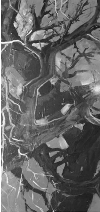
Detalle obra "Entrecruzamiento", Ricardo Arcuri