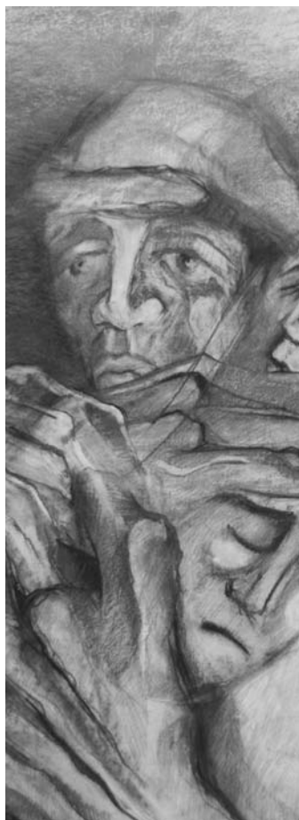
Detalle obra "Protección I", Ricardo Arcuri