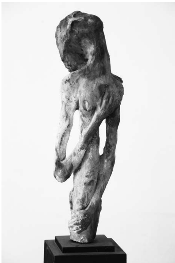
“Espera dramática”, cerámica Ricardo Arcuri

En 1934 el paralelo entre la situación social de los humildes y la condición nacional de las islas era casi directo. Al reivindicar islas sin utilidad aparente para la Argentina, denostaba a un legislador británico que en 1848 las había llamado “Islas Miserables”