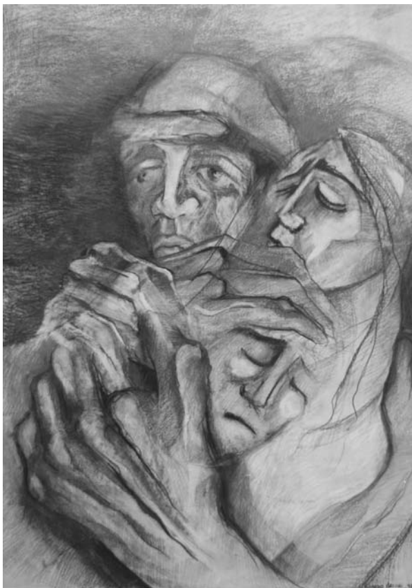
“Protección I”, dibujo, sanguina Ricardo Arcuri

“He luchado durante quince años por elevar el nivel moral y material de los que sufren, y, en nombre de mi partido, obtuve leyes que dignifican el trabajo y gravan el privilegio; que velan por la mujer obrera, para quien yo he deseado ardientemente la igualdad ante la fuerza y la belleza, con respecto a las mujeres de las otras clases; leyes que suprimen la tortura de los niños en las fábricas y que amparan a los pequeñuelos sin madre, huérfanos de todo afecto, que todavía no han caído, y cuyo único delito es el de no haber conocido nunca la dulzura de una caricia materna” (Ibid.:38-9).