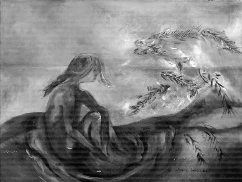
“Alguna vez fue (Cuadro azul)”, óleo Beatriz García