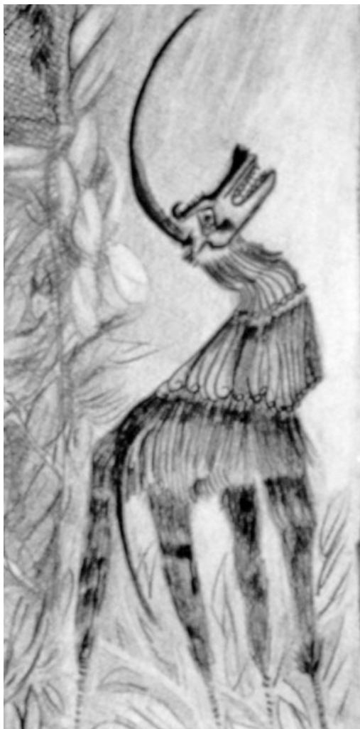
“Repetición 2”, tinta y lápiz Rosario Fernández

A las experiencias positivas se le contraponen las negativas. Es evidente que las experiencias angustiosas que generan los exámenes es la situación más nombrada (28% en los varones y 33% en las mujeres). El examen es el momento en el que se exponen ante un tribunal ocasionándoles a los alumnos una tensión ya que es el momento que define su acreditación según el éxito o fracaso como cierre parcial de un período académico. Además, debemos considerar que siendo las primeras experiencias, éstas se transitan con mayor ansiedad. Por otro lado los alumnos rinden con el objeto de aprobar movidos no sólo en la experiencia individual placentera sino también en función de las expectativas de los padres u otros referentes significativos para estos estudiantes. La tolerancia en estas situaciones varía según los sujetos y sus rasgos propios en virtud de sus procesos singulares de constitución. En las instan-