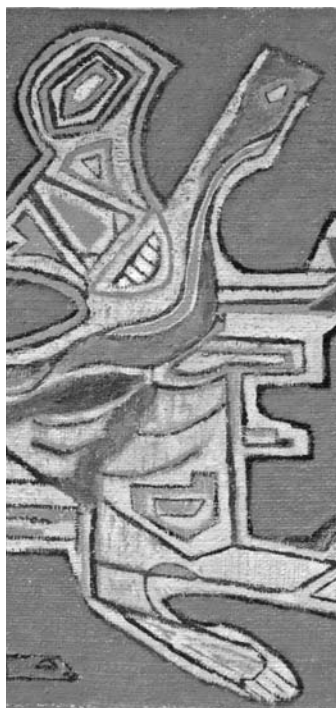
Detalle obra "Habiendo llover", Carlos Oriani