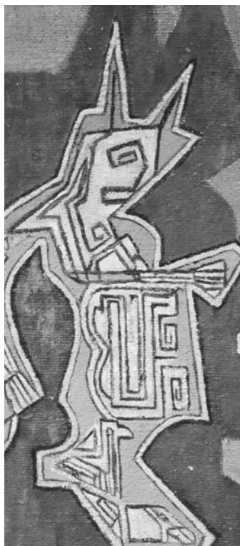
Detalle obra "Diablo", Carlos Oriani