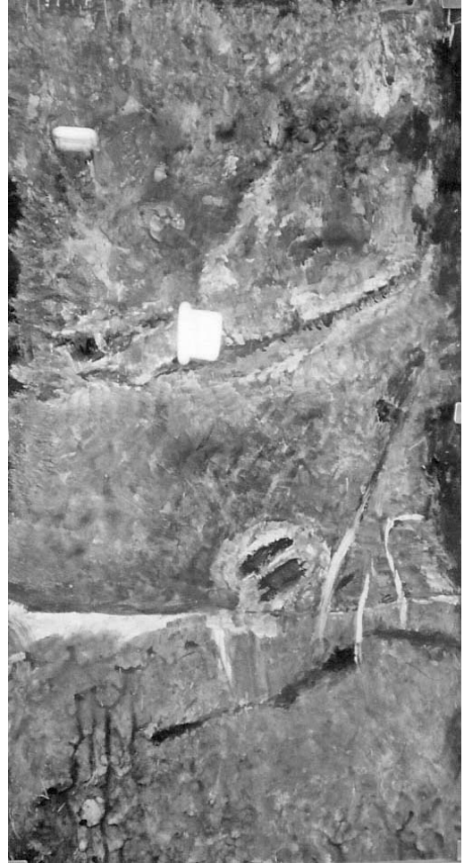
“Sin título”, acrílico Ada Bernardez

Por otra parte, la socialización de la reflexión, el reconocimiento de la complejidad de dicho proceso y de los atravesamientos ideológicos de las teorías y de las prácticas puede resguardarnos de posturas individualistas y simplificadas, permitiéndonos superar una posible excesiva ilusión acerca del poder de la reflexión. Para que la reflexión contribuya a la modificación de los “gajes” del oficio no debe ser espontánea o esporádica. Para que tenga impacto, tanto en los cambios individuales como sociales, es necesario que se internalice como un hábito profesional. Para ello se hace indispensable que se forme a los docentes, desde el inicio de la formación, en el ejercicio de la reflexión. Pero, además, que se trabaje sobre los colectivos docentes, ya que como señala Perrenoud (2006), los hábitos son construcciones personales, realizadas en contextos específicos. Las acciones son siempre objeto de posteriores repre-