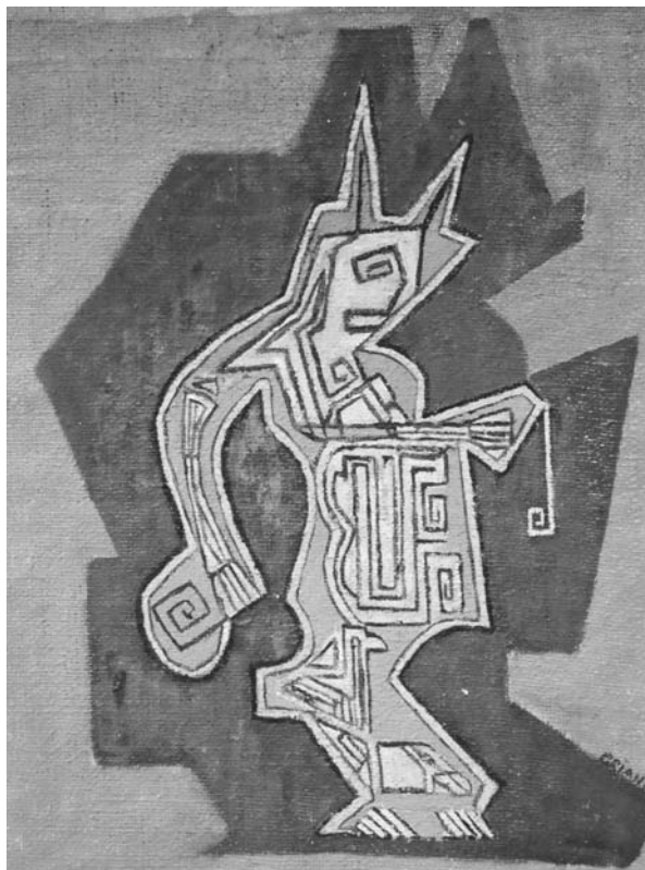
“Diablo”, óleo Carlos Oriani

la práctica requieren algo más que la aplicación mecánica de la teoría. Es necesario que el práctico reconozca y evalúe la situación, la construya como problemática y, a partir de su conocimiento profesional, elabore nuevas respuestas para cada escenario singular.