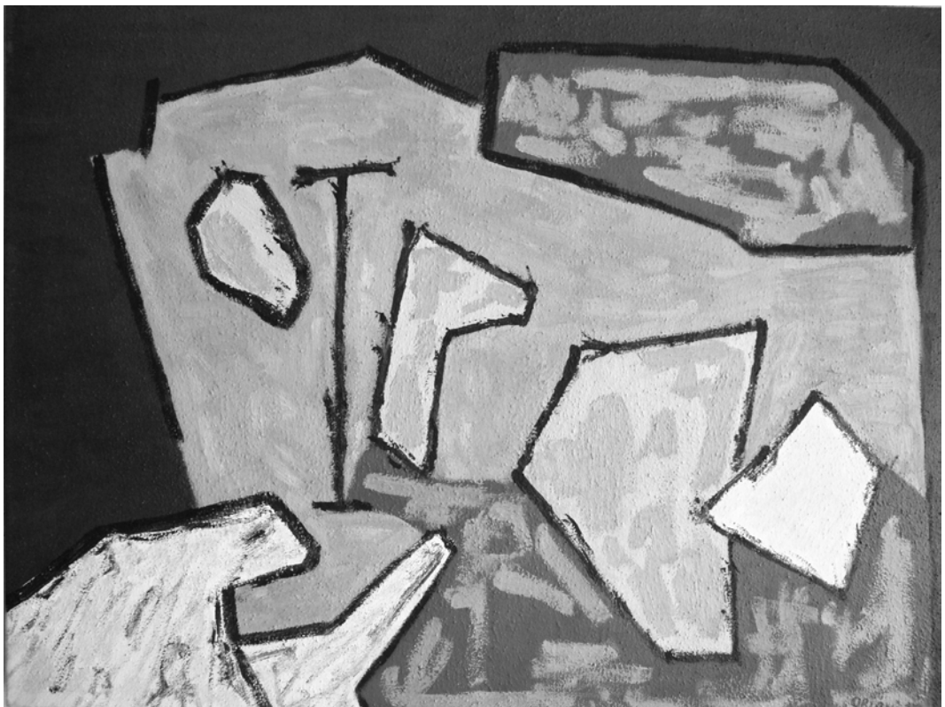
"Juego de polo", óleo Carlos Oriani

Fecha de recepción: 18/11/2010 Primera evaluación: 15/12/2010 Segunda evaluación: 02/02/2011 Fecha de aceptación: 02/02/2011