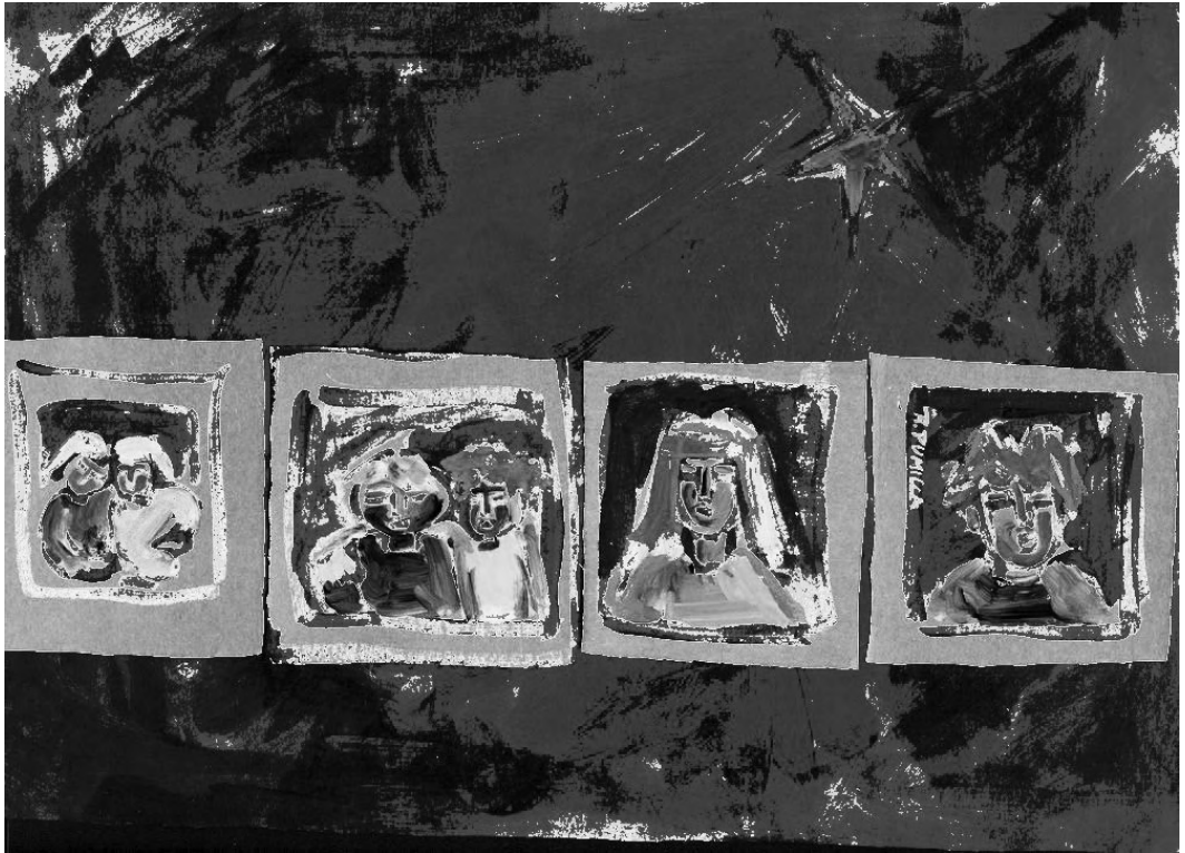
"Tapa dos", Raquel Pumilla

literatura que ya me llevó a estar mucho tiempo leyendo, y después, bueno, me interesaba mucho escribir también en el secundario, y la escritura fue una relación con el lenguaje muy privada y una sensación de poder cambiar algunas cosas a partir de la práctica de la escritura..." (Caso C, ISFD "SB", profesora).