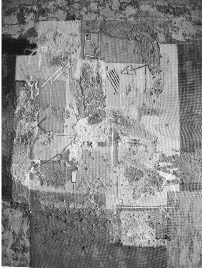
“Inundación”, óleo técnica mixta Carlos Oriani

En un pasaje más avanzado de su testimonio, la misma estudiante hipotetiza otra posibilidad de escritura, más comprometida y menos reproductiva: