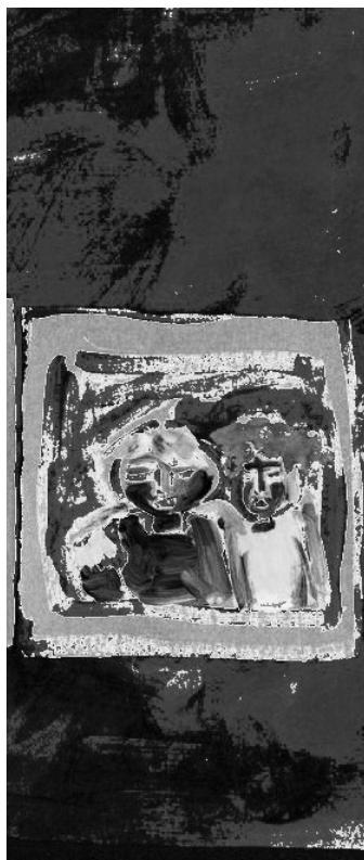
Detalle obra "Tapa dos", Raquel Pumilla