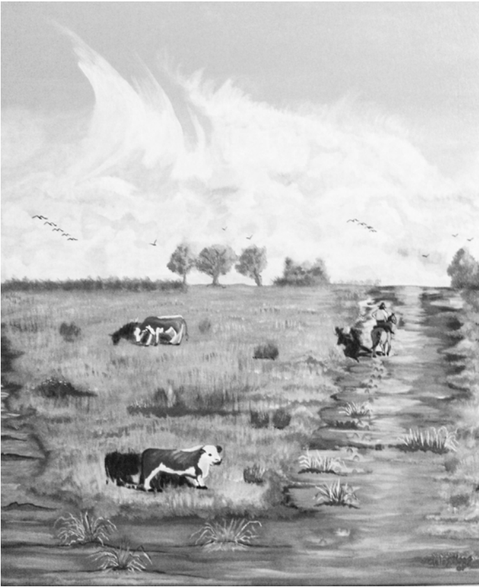
“La cuesta”, acrílico sobre tela Carlos Enrique Mas

— ¡Todo! Son nada menos que cinco “boli-llas”.. respondió César, siempre con su guitarra a punto.