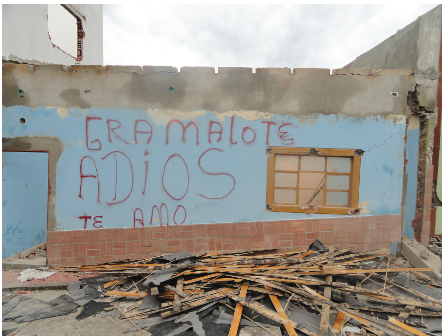
Figura 5. Mensajes durante la evacuación del municipio en el año 2010.