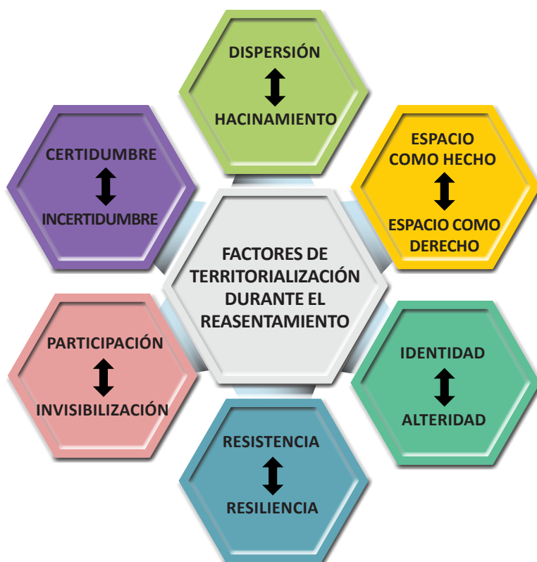
Figura 2. Factores de la territorialización identificados en el discurso de los actores.