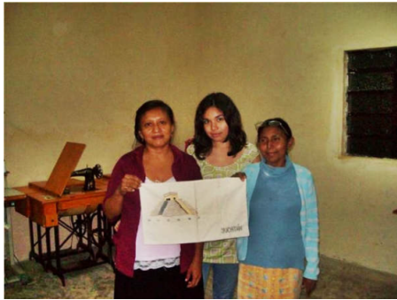
Figura 3: Reconocimiento obtenido por primer lugar.