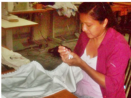
Figura 1: Bordadora en una comunidad rural.