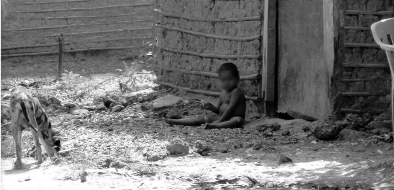
Jugando en el patio. Cartagena 2011.