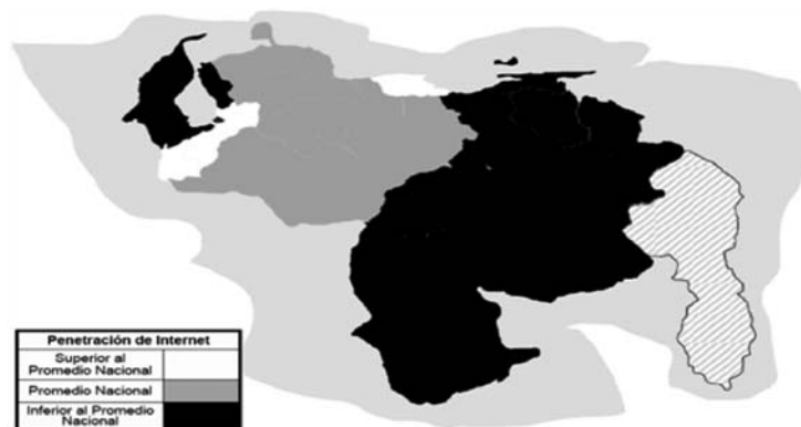
Figura 2 Mapa digital de Venezuela