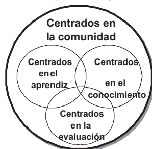
Figura 1. Nuevos Ambientes de Aprendizaje, cuatro perspectivas