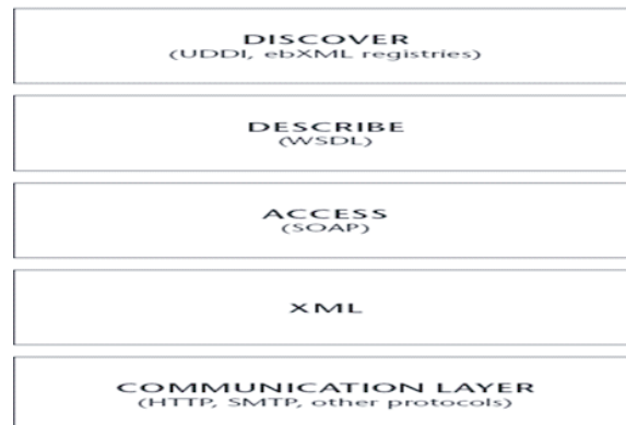
Figura 1 Capaz básicas de los servicios Web