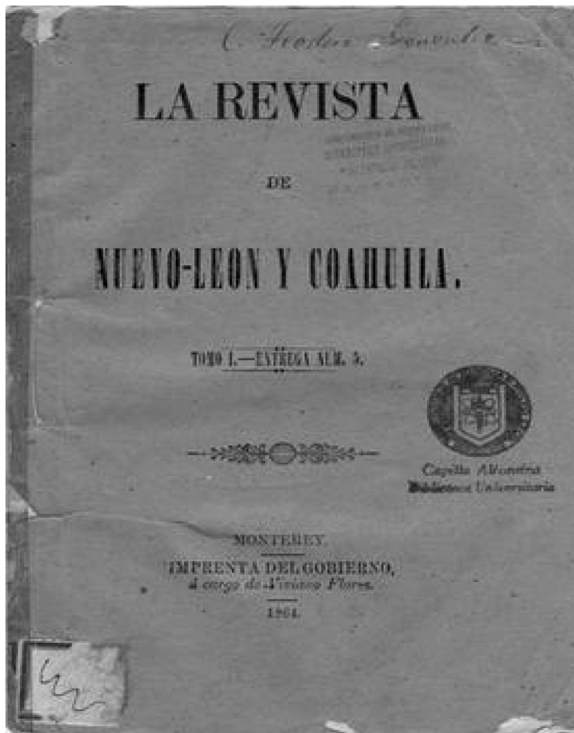
Figura 3. Portada de La Revista de Nuevo-León y Coahuila [1864].