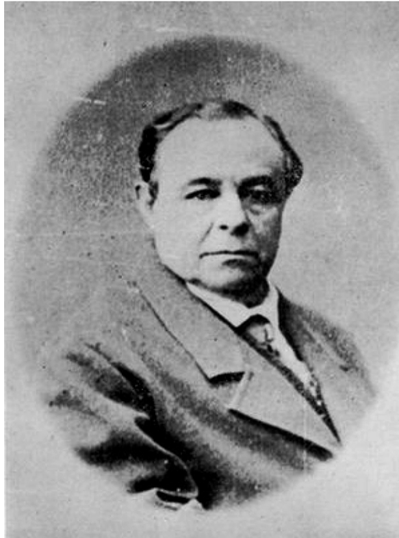
Figura 2. José Eleuterio González [1863].

Fuente: Carlos Pérez-Maldonado (1963). Los Pérez-Maldonado . Monterrey: Imprenta El Regidor.