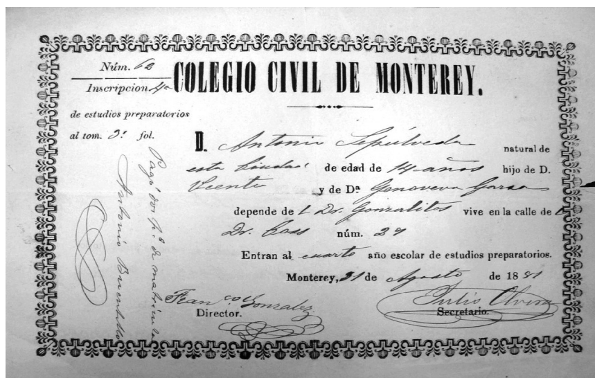
Figura 1. Boleta de inscripción de estudios preparatorios del Colegio Civil de Monterrey [1881].