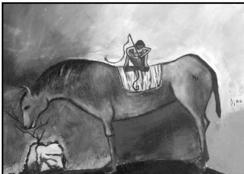
Monje loco , óleo y tela, 25 X 35 cm, 2006.