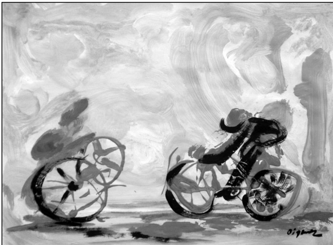
Sergio Elisea, 2007.