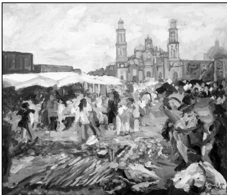
Sergio Elisea, 2007.