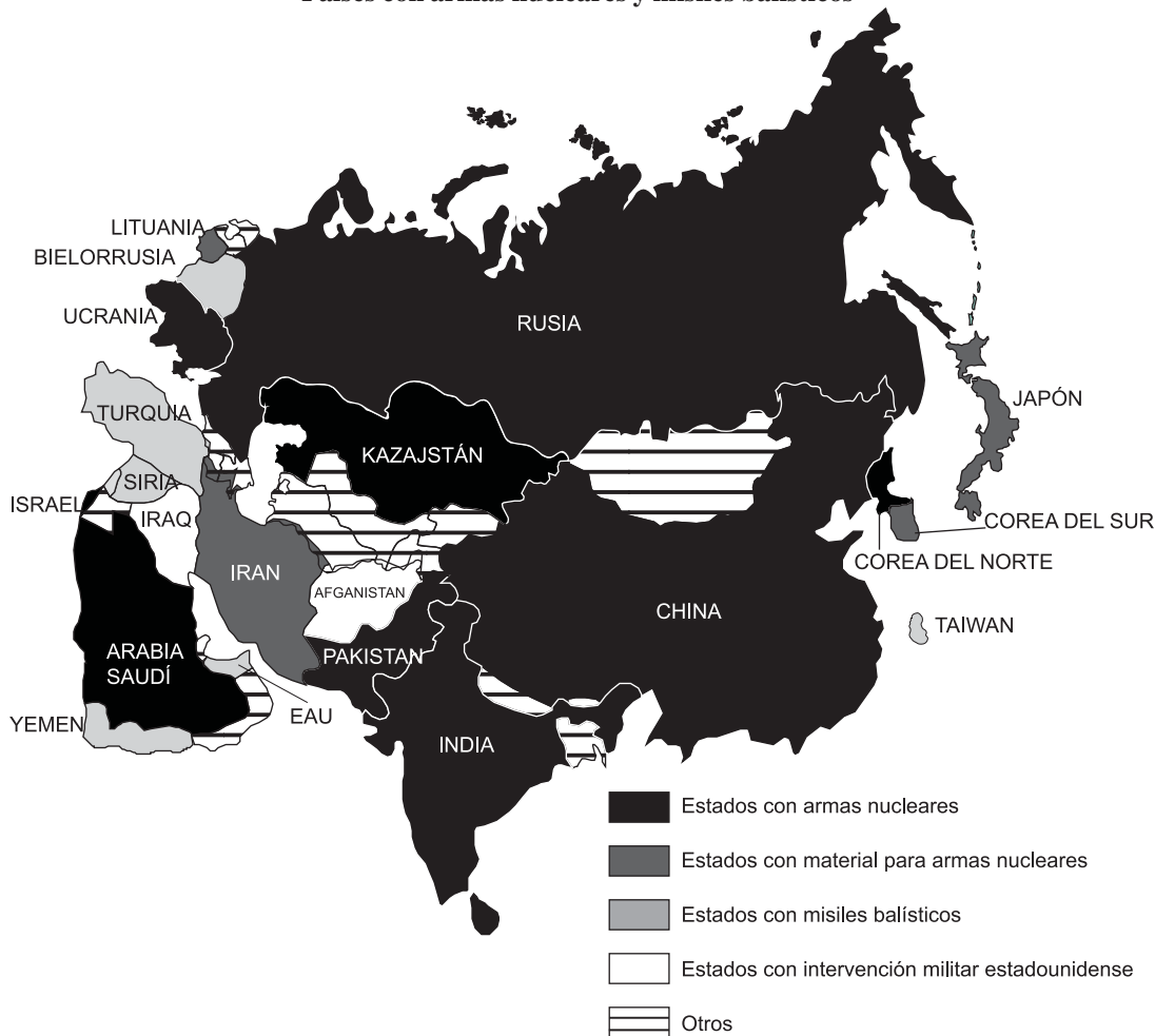
Países con armas nucleares y misiles balísticos

A través de una campaña propagandística que ha obtenido el apoyo de científicos nucleares que son una “autoridad”, las mini-bombas nucleares están siendo presentadas como un instrumento de paz y no como un ins-