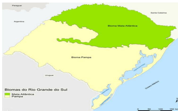
Figura 2: Mapa adaptado de Biomas presentes no Rio Grande do Sul, Brasil