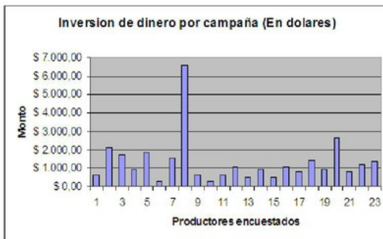
Figura 1: Necesidad de dinero para afrontar campaña 2009-2010 (en dólares)

Fuente: Elaboración propia a partir de encuesta