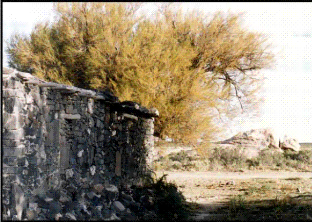
Fotografía 1. Casa construida con piedra de Chos Malal