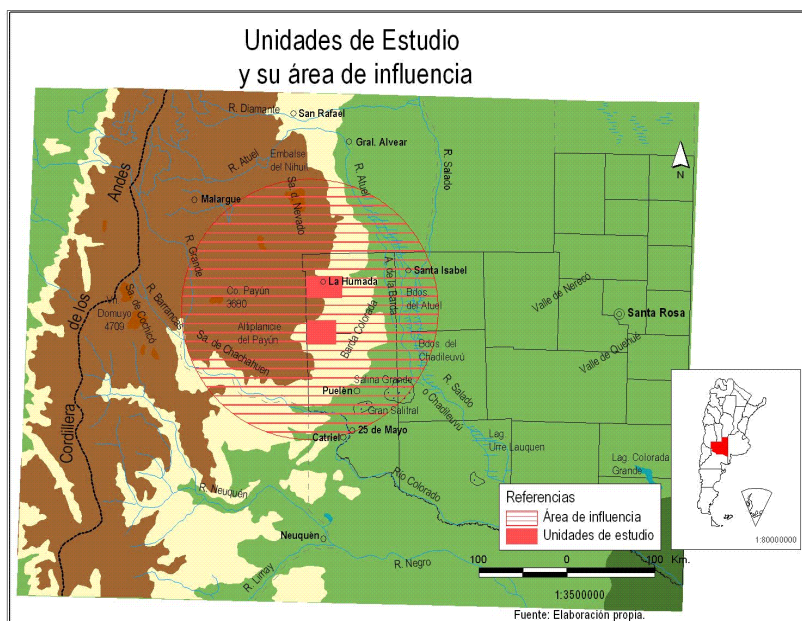
Mapa 1. Posición de las zonas de estudio en la región

desigual acceso a los recursos naturales, por el uso y apropiación del espacio y la construcción de territorialidades.