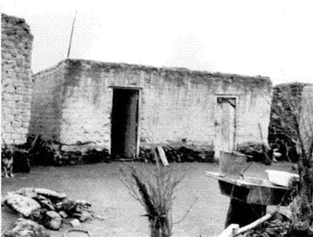
Fotografía 2. Casa de adobe crudo de 1980