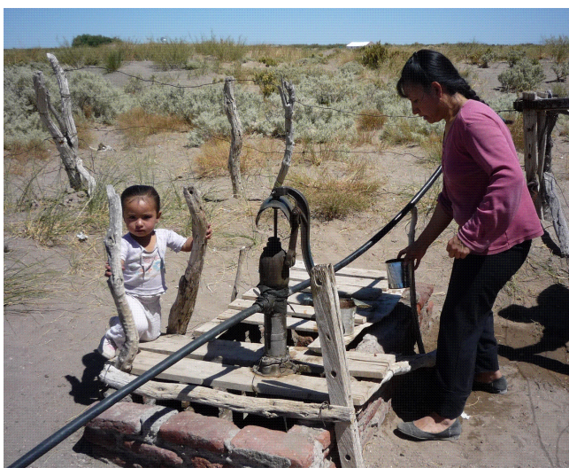
Fotografía 9. Jahuel a tracción mecánica