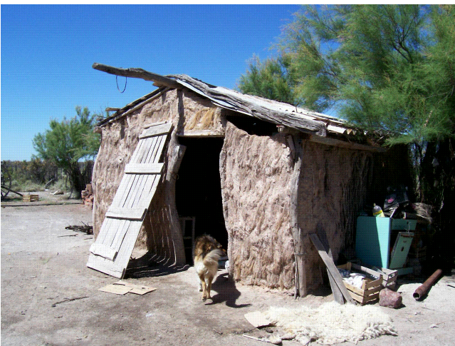
Fotografía 3. Vivienda construida con el método chorizo y revocada