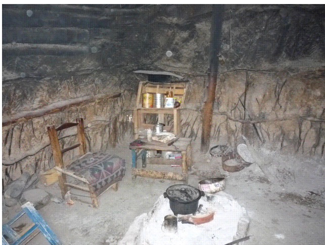
Fotografía 8. Interior de "cocinita" de pichana

concentran en la zona de La Humada. No son elementos usuales en Chos Malal donde muy pocas familias crían ganado vacuno.