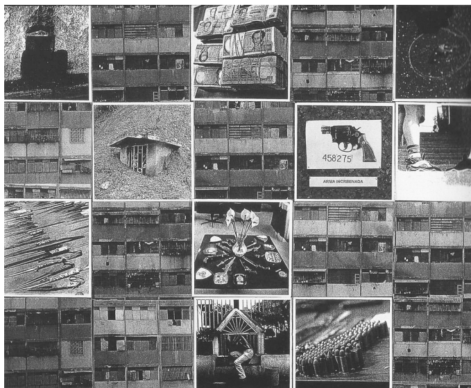
Autor: Susana Arwas. Título: Más salao que un bacalao, de la serie Audiovisuales, 1999. Fuente: María Teresa Boulton. 21 Fotografías Venezolanas. Caracas: Fundación Cisneros, 2002; 157.