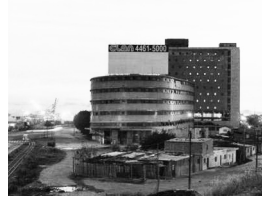
Eduardo Carrera. Una imagen urbana. http://tramas.flacso.org.ar/recursos/imagenes/una-fotografia-urbana .

Al final de esta investigación apenas se ha develado esa relación ambivalente entre nosotros y la ciudad, ese nexo de amor y odio en el que se debaten la mayoría de los ciudadanos. Se trata de esa idea dicotómica de ciudad que, circunstancialmente, coexiste en el colectivo latinoamericano, impregnando nuestra convivencia citadina: la ciudad bifronte; es decir, la ciudad ideal o positiva y la ciudad real o negativa.