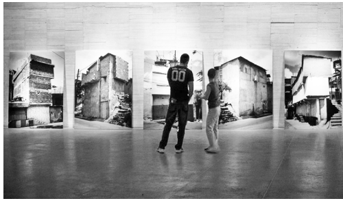
Alexander Apóstol. Ranchos, de la serie Residente Pulido, 2003. http://www.alexanderapostol.com/06_residenteRanchosbis.php

fotográficos de un archivo visual sobre Caracas donde el caos es inherente a la condición urbana. Es una aproximación documental de la imagen de la ciudad contemporánea, a cualquiera de ellas. Lo que se ve sitúa al espectador frente a la representación de un imaginario urbano sin frontera: