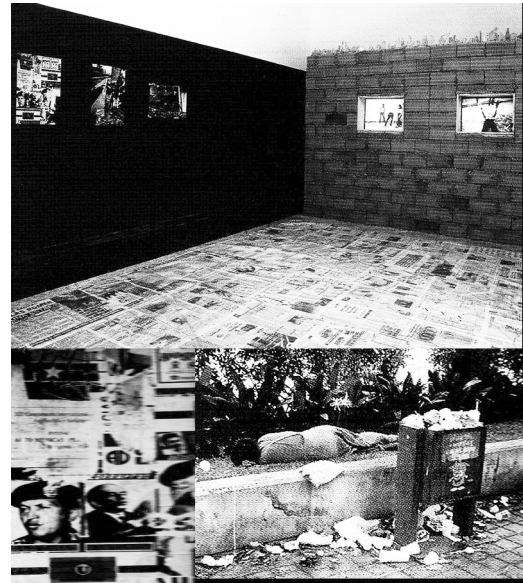
Autor: Antonieta Sosa.

Por otra parte, en la misma búsqueda reflexiva sobre el tema de la violencia que abanderó más de un artista contemporáneo latinoamericano, en el periodo de finales del siglo xx y comienzos del siglo xxi, la reconocida fotógrafa venezolana Susana Arwas, ganadora de varios premios nacionales, produjo, en 1999, la serie Audiovisual en la que destaca el collage Más salao que un bacalao . En esta obra, la artista muestra más de un icono del lado oscuro de la ciudad, al que todos los latinoamericanos parecen estar acostumbrados. Se trata de la imagen de una ciudad violenta por naturaleza, asediada por los problemas de pobreza,