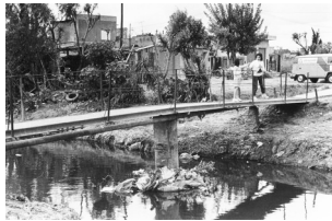
Fotografías de Alicia D'Amico, publicadas en el libro Podría ser yo , de Elizabeth Jelin y Pablo Vila. Buenos Aires: CEDES - Ediciones de la Flor, 1987.

muchos de los vecinos, como un problema serio que requería algún tipo de solución.