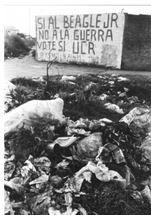
Fotografías de Alicia D’Amico, publicadas en el libro Podría ser yo , de Elizabeth Jelin y Pablo Vila. Buenos Aires: CEDES - Ediciones de la Flor, 1987.

Este regreso programado en la reunión convocada fue una vuelta a ver el barrio y a muchos de los vecinos y vecinas que fueron retratados por Alicia D’Amico a mediados de los ochenta. Si la fotografía, por definición, es el pasado, aquí ella representaba un pasado bastante lejano. Por esto, la reunión fue muy emotiva; la gente (la que estuvo antes y la que no conocía esa historia) identificó tomas y lugares, reconoció personas (a sí mismos y a otros y otras en una foto; vieron chicos que ya son grandes, casados y con hijos; reconocieron gente que ya murió; identificaron lugares, calles, esquinas, etcétera). Parte de la emoción tenía que ver también con que las fotografías los retrotraían a la historia de luchas del barrio, historia que se había desarrollado en varias etapas y, en realidad, por grupos de vecinos distintos. Más allá de las intenciones de unos y otras de participar en la reunión, lo interesante fue que todos y todas –viejas(os) y nuevos(as)– se involucraron activamente en la discusión de las tomas. Incluso recordaron lo importante que fue para la historia del barrio y de la institución el proyecto de investigación que culminó con la publicación de Podría ser yo : “Y yo me acuerdo que nosotros ahí vimos