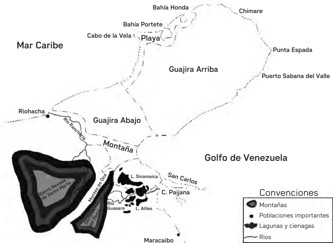
Mapa 2. División Territorial de la Guajira según los nativos

Fuente: Homer Aschmann, "Indian pastorlist of the Guajira peninsula", En Annals of the association of the American geographers , Vol. 50, N. 4, pp. 408-418. Francisco Pichón, Geografía de la Península Guajira . Santa Marta. (Escofet, 1947)