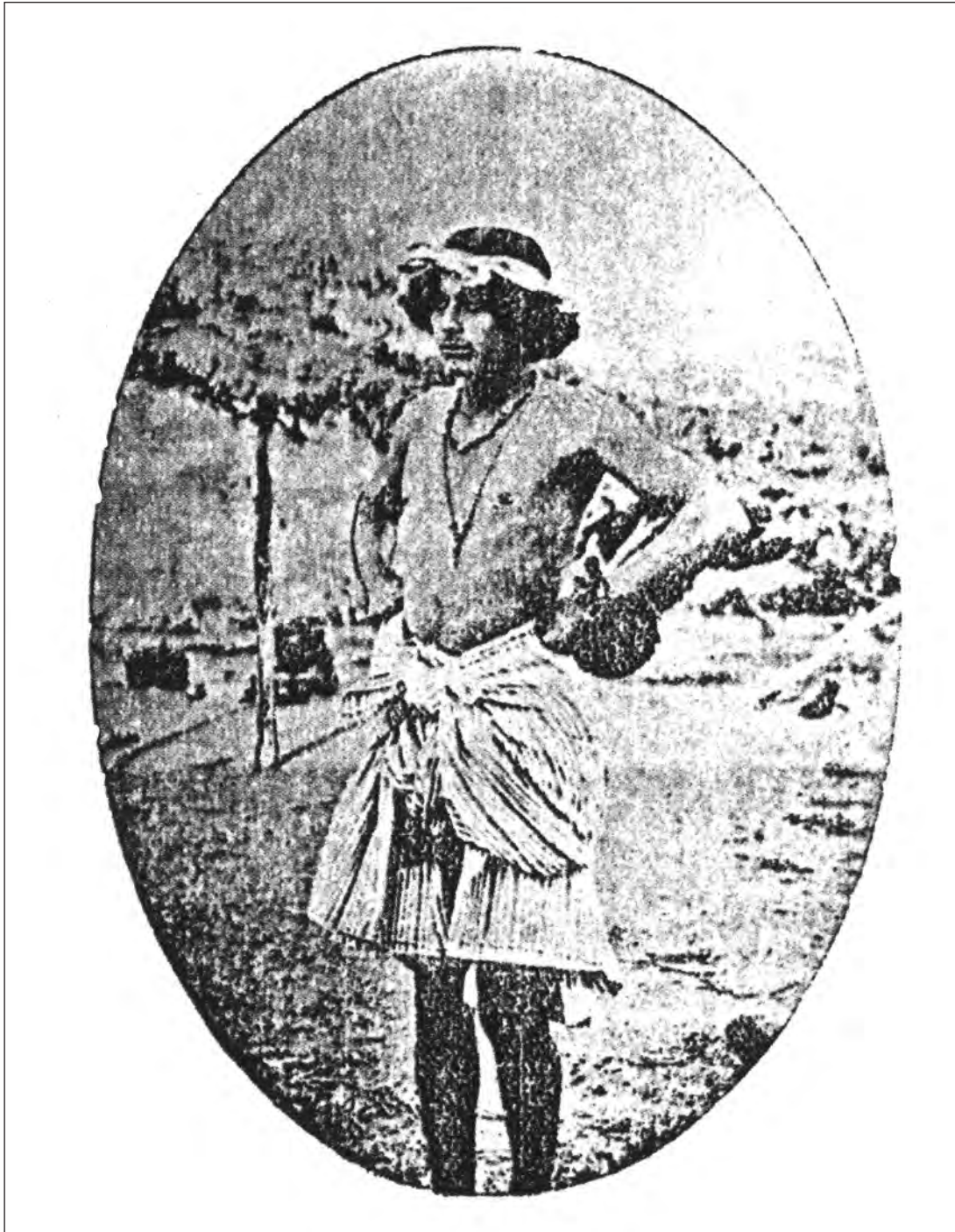
"Tipo de Indio Goajiro"

Miguel Triana, Revista de Colombia. Volumen Centenario. Bogotá. Imprenta de J. Casís, 1910. Impreso, BLAA - Banco de la República.