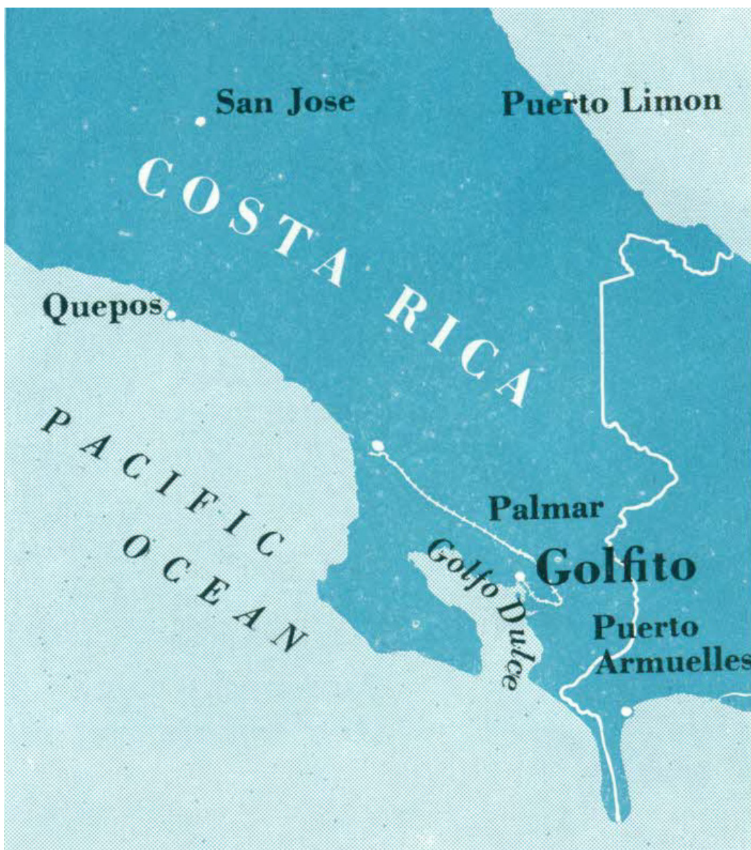
■ FIGURA 1. DIVISIÓN GOLFITO, 1949.