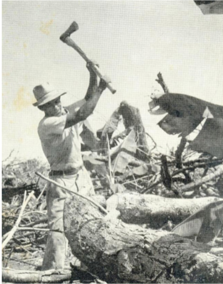
■ FIGURA 4. EL HACHERO.