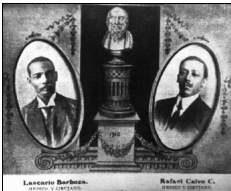
Médicos mulatos egresados de la Universidad de Cartagena a

Otro eje central de ese protagonismo fue la valoración que otorgaron a la educación. Alrededor del estudio organizaron un cuerpo de ideas que lo realizaba como único factor de progreso individual y social y elemento determinante de la estimación de los demás. Algunos talleres fueron epicentros de sociabilidad cultural y política en los que se difundían y discutían lecturas que circulaban de mano en mano. Con colecciones de periódicos, folletos, revistas, libros, afiches, carteles, literatura de folletín, etc., era usual que a muchos talleres artesanales concurrieran personas de diversa extracción social, interesadas en el diálogo, en el intercambio de ideas con artesanos interlocutores que llamaban la atención por sus expresiones iconoclastas y por sus apuntes picantes sobre la cotidianidad. Algunos artesanos se convirtieron en una especie de librepensadores, en eso que el Eric Hobsbawm (1979: 144-184) llamó “ideólogos del pueblo llano” en un artículo dedicado a los zapateros políticos europeos del siglo XIX. Durante el último cuarto del siglo XIX sobresalió en Cartagena el zapatero Manuel Araujo, reconocido “... por su charla impregnada de cierta filosofía burlona para aceptar y comentar la tragicomedia de la vida” (Lemaitre, 1983: 233-304; Lemaitre, 1990: 44).