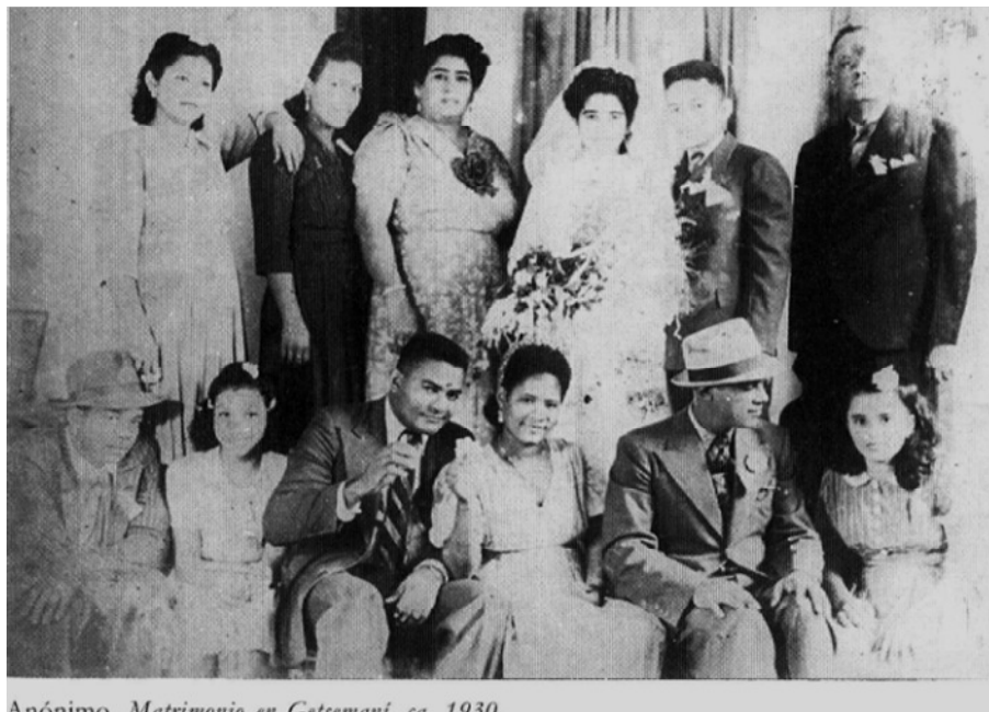
Anónimo. Matrimonio en Getsemani, ca. 1930.