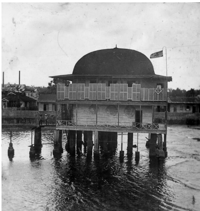
Templo masónico de la logia Unión Fraternal de Puerto Limón.