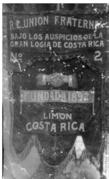
Estandarte de la Logia Unión Fraternal de Puerto Limón.