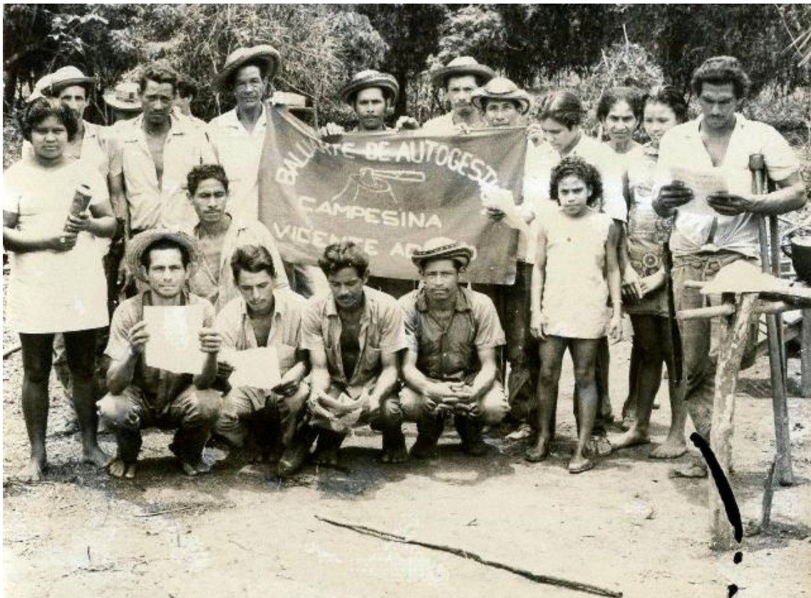
Reunión de usuarios. Comienzos de la década de los 70s (099-3)