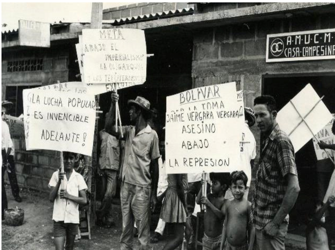
Desfile Usuarios (Montería 1973) (2)