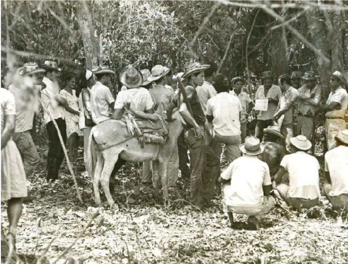
Reunión de usuarios. Comienzos de la década de los 70s (099-5)