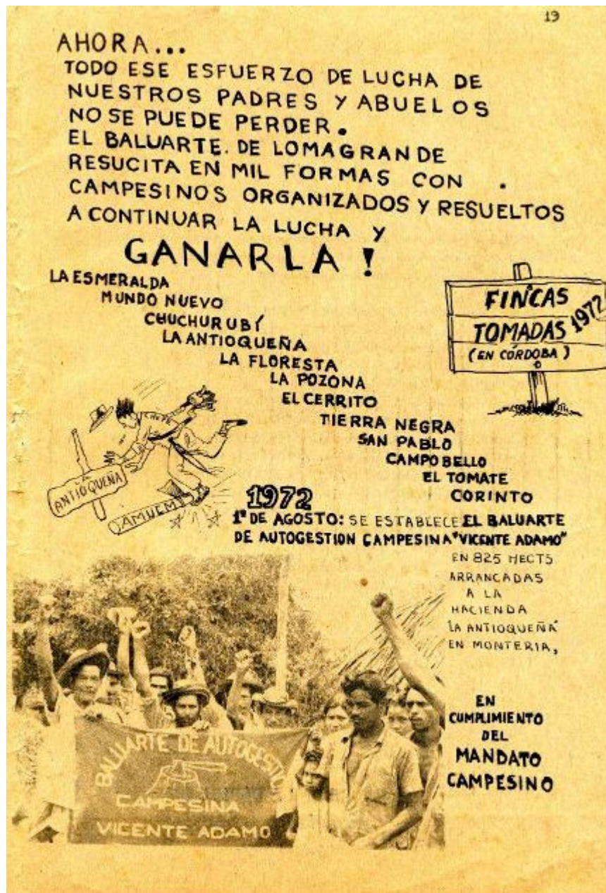
Folleto Lomagrande el baluarte del Sinú. 1972 (063)