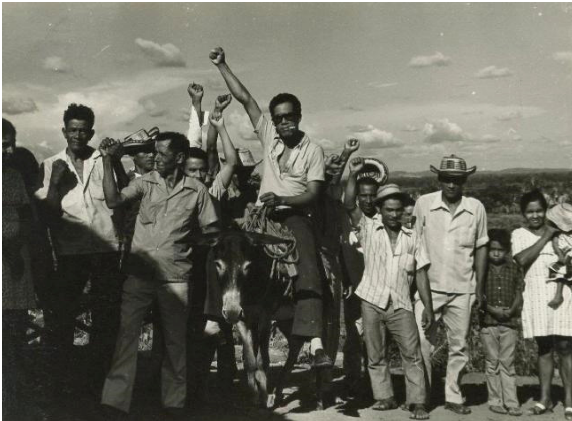
Cursillo de capacitación para campesinos. Década de los 70s (091-2)