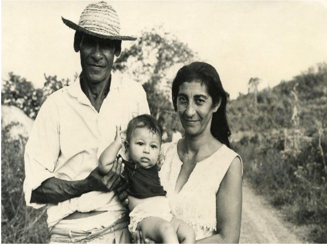
Familia campesina. Comienzos de la década de los 70s (086)