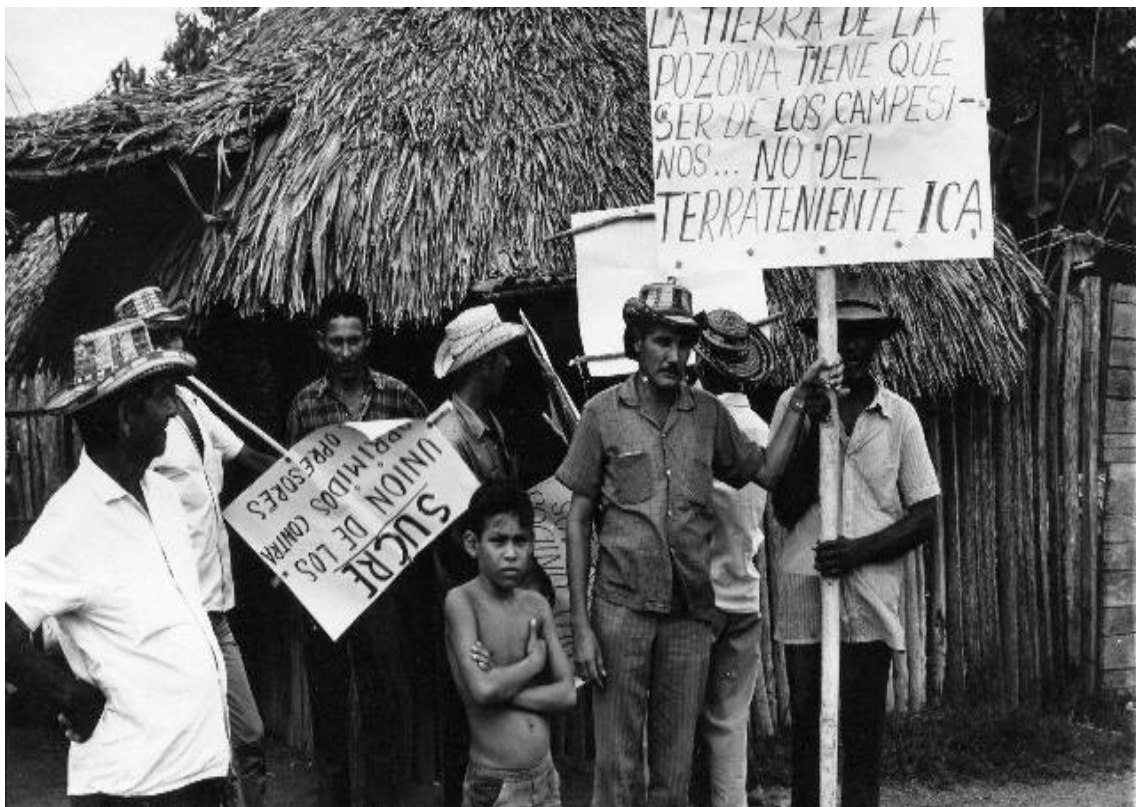
Desfile Usuarios (Montería 1973)