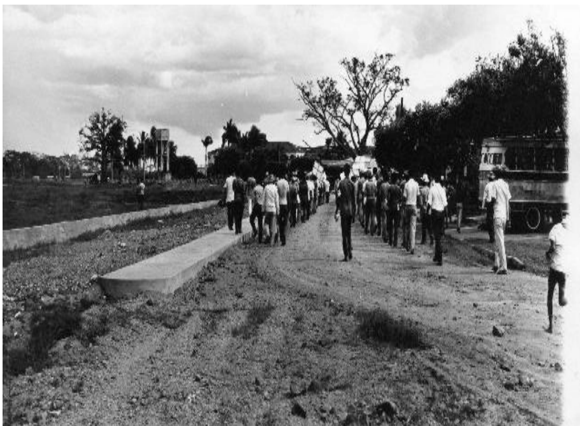
Desfile Usuarios (Montería 1973) (6)