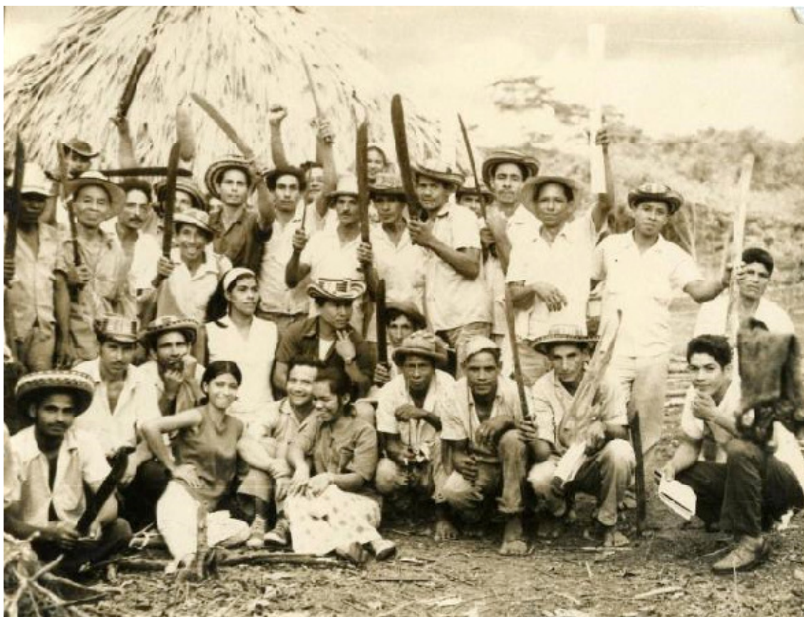
Reunión de usuarios. Comienzos de la década de los 70s (100)