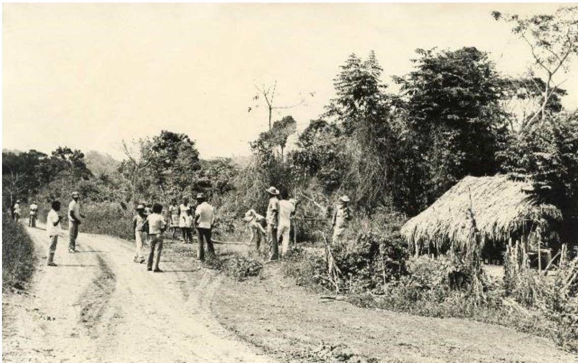
Trabajos de limpieza. Comienzos de la década de los 70s (084)