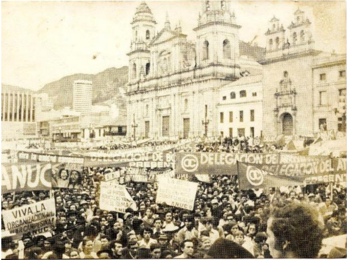
3er congreso ANUC. Plaza de Bolívar. Bogotá, 1974