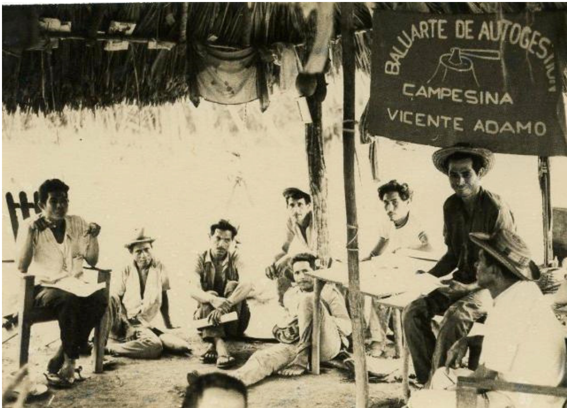
Cursillo de capacitación para campesinos. Década de los 70s (091-1)