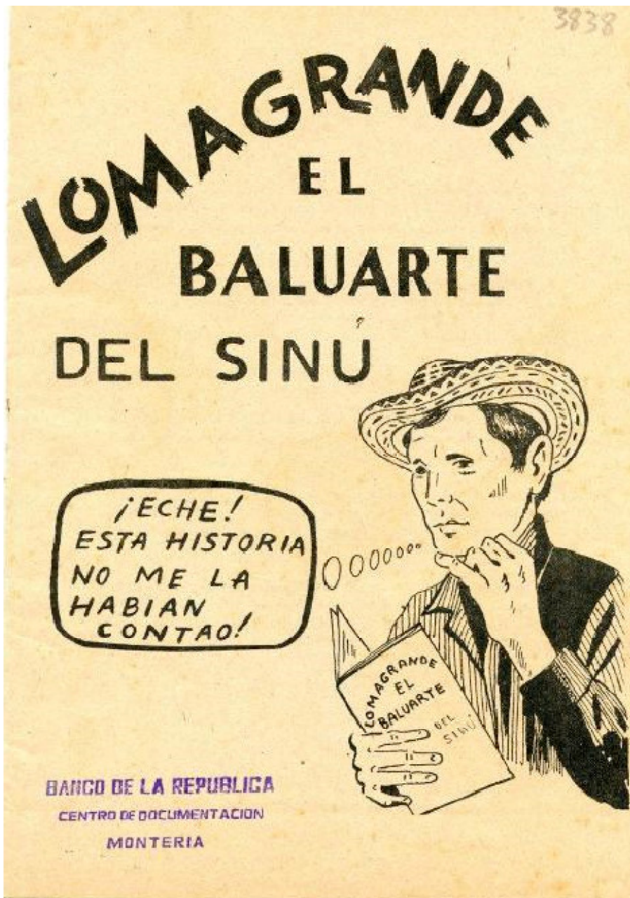
Portada de Folleto Lomagrande el baluarte del Sinú. 1972 (062)