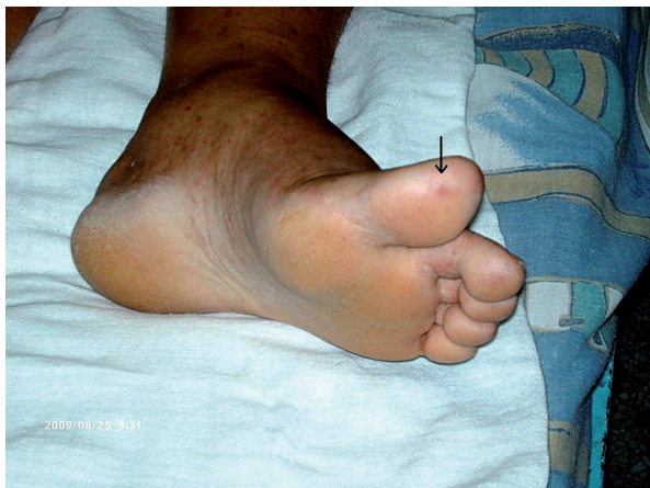
Figura 3. Fotografía que muestra la presencia de un nódulo de Osler en el pulpejo del hallux izquierdo (ver flecha) de la misma paciente.