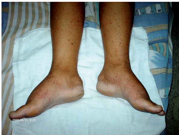
Figura 1. Nótese el rash purpúrico-petequial, distribuido fundamentalmente en los miembros inferiores, compatible con unas vasculitis secundaria, en una paciente con endocarditis subaguda por Streptococcus bovis .