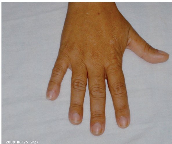
Figura 2. El examen físico también evidenció la aparición incipiente de dedos con uñas en "vidrio de reloj".