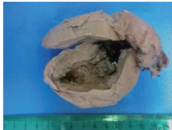
Figura 1. Vesícula biliar aumentada de volumen con lesión tumoral infiltrativa difusa.

Se encontró vesícula biliar aumentada de volumen de color pardo amarillento, la cual midió 11,4 cm de longitud por 4,2 cm de diámetro mayor transverso. Externamente mostró adherencias fibrosas sin presencia de implantes tumorales. Al abrir la pieza quirúrgica, la arquitectura del órgano se encontró distorsionada y estaba reemplazada por lesión tumoral infiltrativa difusa que comprometía todo el espesor de la pared, la cual alcanzaba hasta 1,9 cm de espesor. Se trataba de una lesión blanco amarillenta con áreas carnosas y zonas focales con hemorragia reciente y necrosis. Superficialmente se encontró ulcerada y en profundidad ocupaba todo el espesor de la pared. En la luz había múltiples cálculos biliares mixtos facetados de hasta 0,8 cm de diámetro (ver Figura 1).