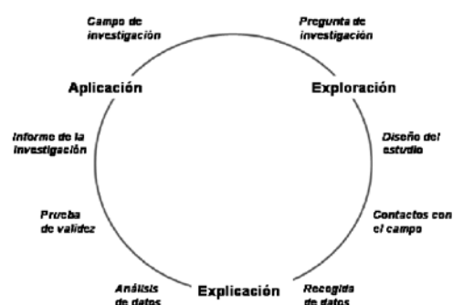
Fig. 1: El proceso cíclico de investigación y sus fases

La figura 1 muestra el proceso de investigación como ciclo de distintas fases, que se engranan y que el investigador puede recorrer distintas veces, dependiente de su proceder científico: