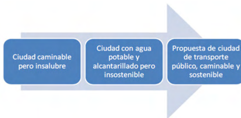
Gráfico N.º 2 Evolución esquemática del pensamiento sobre urbanismo y transporte

A partir de lo dicho quisiera introducir en esta tercera parte un nuevo elemento: el equilibrio. Equilibrio es un concepto clave y lo es en muchos sentidos. En primer lugar, referido a la complementación entre pasado y futuro. Revertir el problema no pasa por un retorno a las cavernas ni tampoco por entregarse a la solucionática tecnológica. Resulta esclarecedora al respecto la revisión histórica-urbana que Jacob y Pardo (2010) hacen de las ciudades y que resumen en el Gráfico N.º 2. Éste permite comparar, en tres etapas, la caminabilidad y salubridad entre las ciudades pre-industriales y post-industriales. Al extremo derecho de la figura, la ciudad futura (en algunos felices casos ya casi presente) rescata lo bueno del pasado sin renunciar a lo presente.