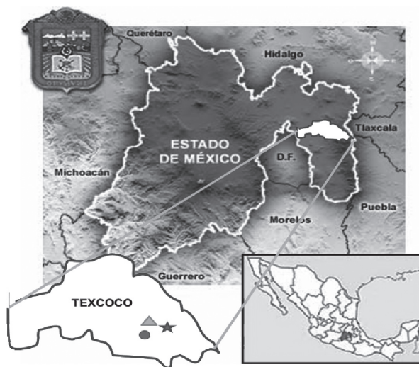
MAPA 1 Localización de las tres comunidades de Texcoco, en el Estado de México*

* En el mapa del municipio de Texcoco se señala con un círculo a Tequexquináhuac, con un triángulo a San Miguel Tlaixpan y con la estrella a Santa Catarina del Monte.