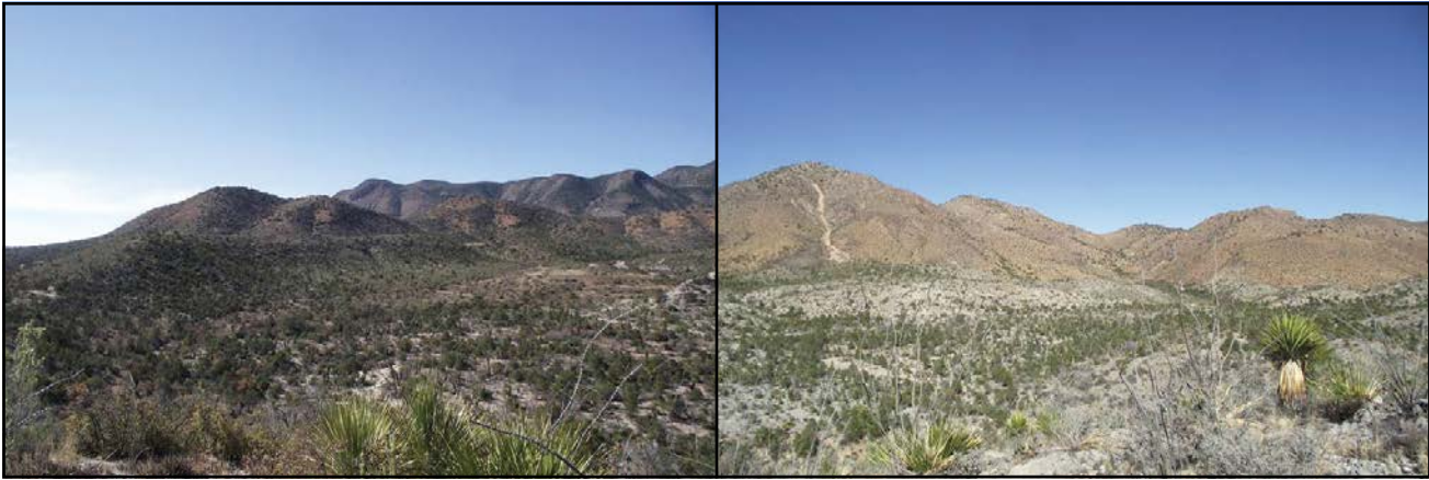
Figura 2. Diferencias de la fisonomía vegetal, exposición norte (izq.) y exposición sur (der.). Sitio ubicado al noreste de la sierra, en Sierra Rica, Manuel Benavides, Chihuahua, México.

y Cañón de los Fresnos. El Cañón de la Madera se ubica a una mayor elevación, desde los 1,700 hasta los 2,100 m.s.n.m. con especies adaptadas a climas más templados como Cupressus arizonica y Juniperus deppeana . El Cañón de la Consolación se ubica en un rango altitudinal desde los 1,500 hasta los 1,800 m.s.n.m., en donde la vegetación de las partes más bajas son arbóreas como Salix babylonica y Juglans microcarpa , mientras que el Cañón de los Fresnos presenta el mismo rango altitudinal, y diferentes especies como Fraxinus americana , F. velutina y Prunus serotina . Los tres cañones muestran diferentes especies establecidas a distintos rangos de altitud y humedad.