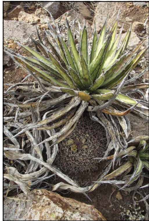
Figura 4. Agave lechuguilla como nodriza de Mammillaria heyderi en Sierra Rica, Manuel Benavides, Chihuahua, México.

Diferentes especies de murciélago del DC, como el murciélago trompudo ( Choeronycteris mexicana ) y el murciélago maguero menor ( Leptonycteris