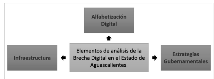
Figura 1. Elementos de análisis de la brecha digital en el estado de Aguascalientes.

Para obtener una apreciación lo más amplia posible sobre la brecha digital del Estado de Aguascalientes, se presentará información desde tres perspectivas: Infraestructura, Alfabetización digital y Estrategias gubernamentales (ver Figura 1).