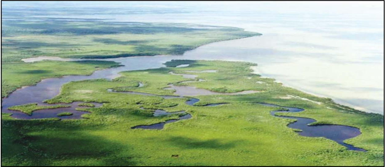
Figura 2. Panorámica de los sistemas acuáticos de la Reserva de la Biósfera Sian Ka'an.