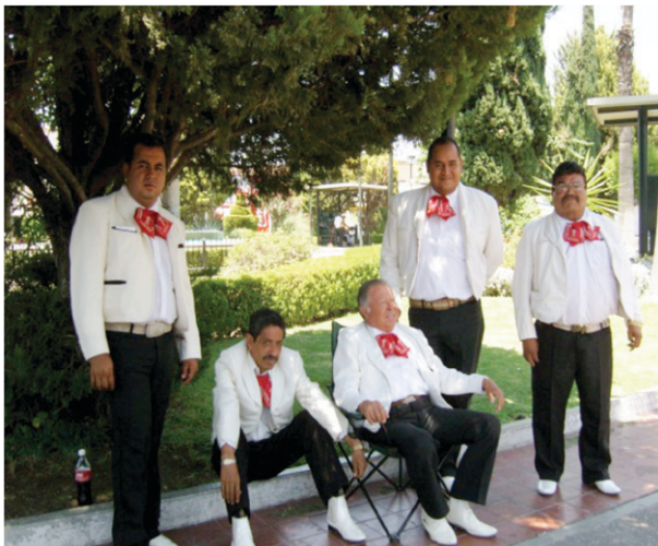
Figura 2. Fotografía de Mariachi en espera de ser contratado en el Jardín Zaragoza.