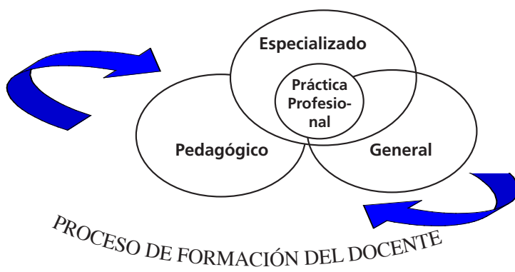
Gráfico 1 Elaborado a partir del diseño para la formación del docente en Educación Intercultural (vigente) Fernández, Magro y Ramírez (2007).

Desde esta visión estructurada, al menos desde lo teórico, se aspira a que el Componente de Práctica Profesional constituya el eje de encuentro entre los conocimientos teóricos y metodológicos que suministran los otros tres (3) componentes del diseño curricular con el contexto real donde actuará el egresado, allí demostrará sus competencias para transferirlos a una situación concreta de enseñanza donde se interrelacionen los conocimientos establecidos desde la educación oficial, con los saberes provenientes de la cotidianidad educativa, cultural y lingüística del respectivo pueblo indígena.