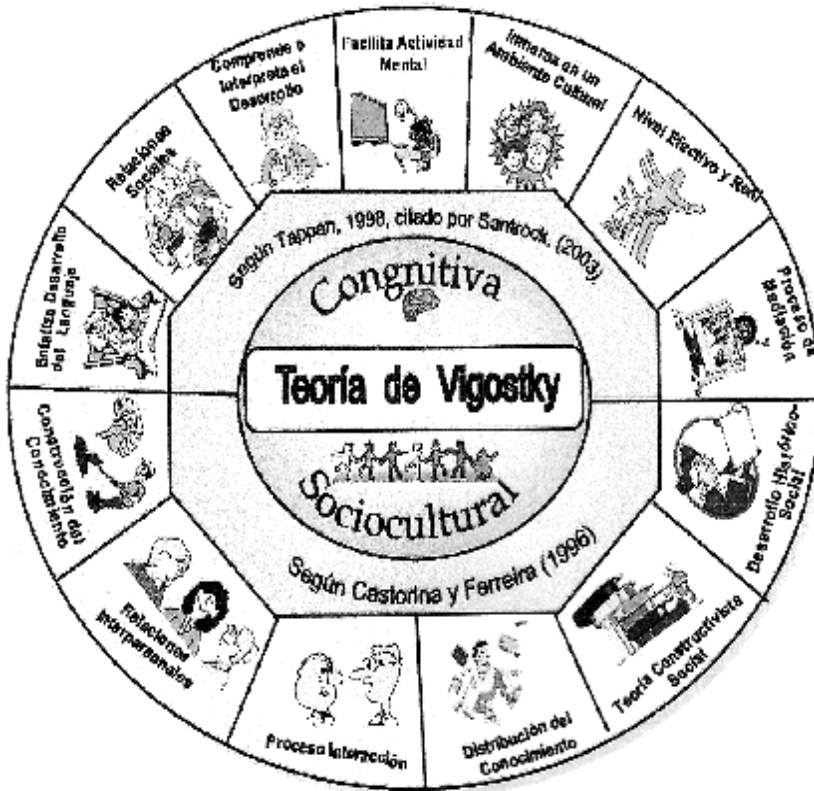
Gráfico 1. Mandala de la teoría cognitiva sociocultural de Vygotsky. La ilustración se adaptó a las preposiciones expuestas en el libro la Psicología de la Educación . Santrock, J. (2000), pp. 40-47.

En el gráfico 1 se ilustra las ideas esenciales de la teoría sociocultural de Vygotsky. El autor postula que al establecer relaciones interpersonales con los agentes mediadores, el ser humano desarrolla los procesos psicológicos superiores, lo cual implica que a través de la educación se promueve el desarrollo individual de los miembros del grupo y la asimilación y producción de la cultura del grupo.