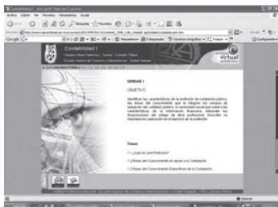
Figura 1. Materiales disponibles en la plataforma

Al inicio del semestre se entregaba al estudiante un CD interactivo del curso y una clave de usuario y contraseña para acceso a la plataforma Blackboard, así como un curso de inducción para el manejo de las tecnologías utilizadas.