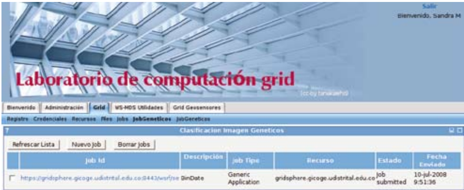
Figura 5. Lista de jobs en recursos en la grid