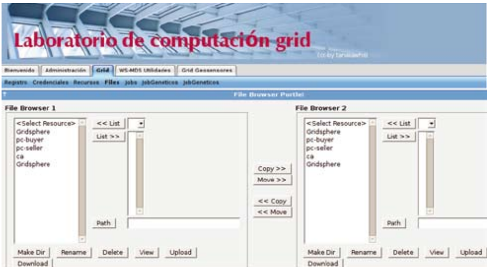
Figura 6. Portlet para el manejo de archivos remotos