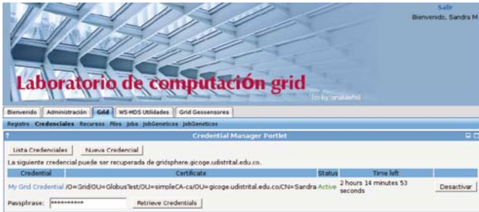
Figura 4. Recuperación de la credencial en el portal