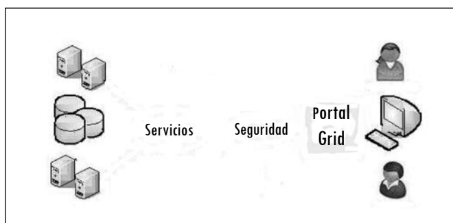
Figura 1. Propuesta del modelo de portal para el Laboratorio de Computación Grid de Gicoge