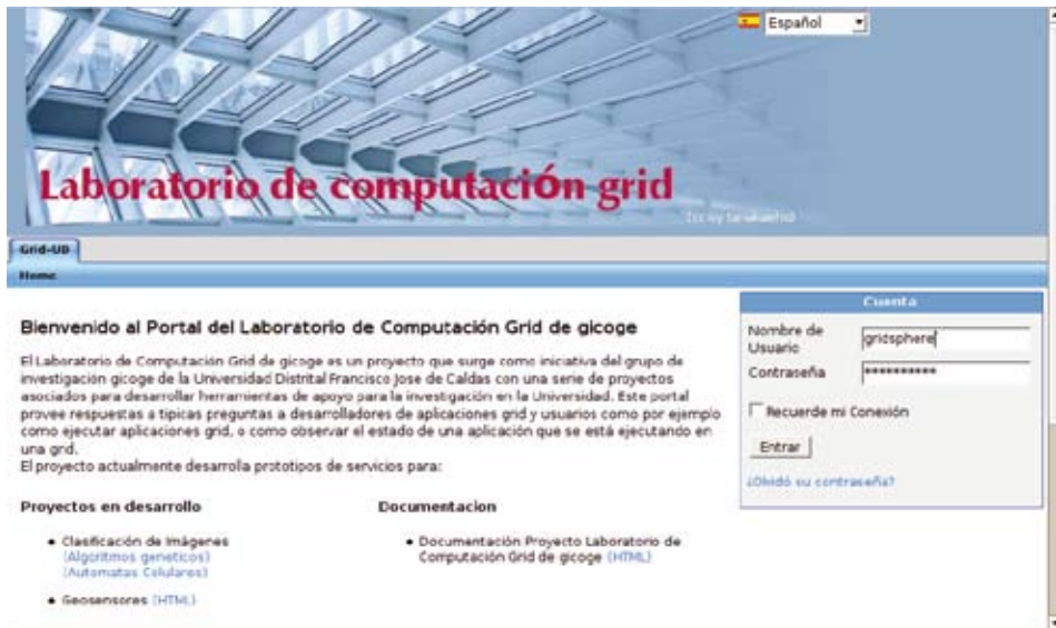
Figura 2. Página principal del portal grid para el Laboratorio de Computación Grid de Gicoge